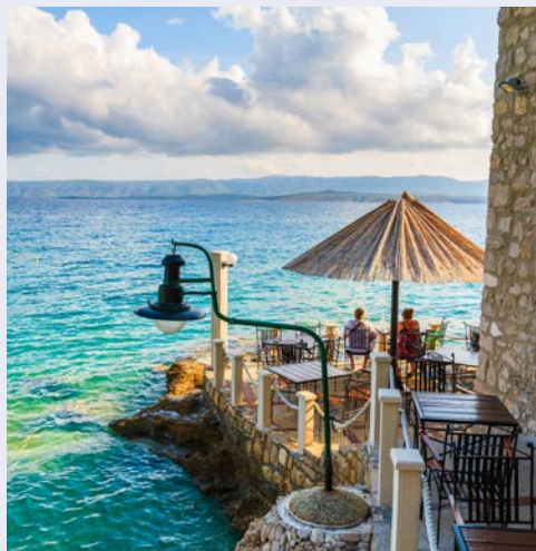
Herrliche Plätze erwarten Sie! Hier auf der Insel Brac

Der Routenverlauf kann wetterbedingt geändert werden.