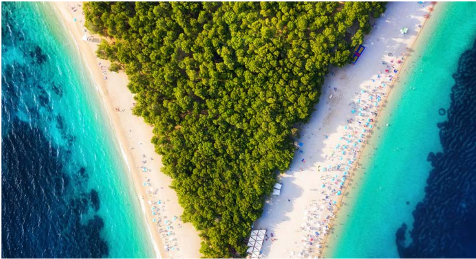
Blick auf das „Goldene Horn“