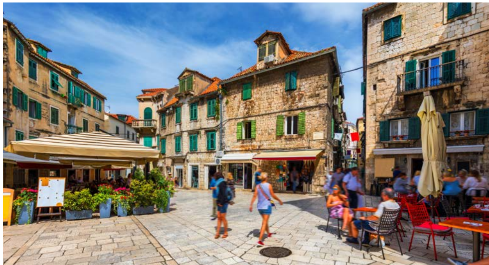
Split heißt Sie zur Ein- und Ausschiffung willkommen

Nur rund zwei Flugstunden von uns entfernt befindet sich ein wahres Paradies. Blau schimmert das Adriatische Meer, golden erstrahlt die Sonne und grün erscheinen die vielen kleinen Inseln, die wie zufällig ins Meer geworfen das wunderschöne Gewirr namens Kroatien bilden. Erkunden Sie dieses bezaubernde Stückchen Erde an Bord der Motoryacht APOLON. Genießen Sie vom Wasser aus das traumhafte Panorama der Küstenlandschaft, pittoreske Inselansichten und verwunschene Buchten. Ein abwechslungsreiches Besichtigungsprogramm sorgt für fantastische Entdeckungen. Kleine Inselstädte mit mittelalterlichem Charme warten ebenso auf Ihren Besuch wie idyllische Orte, die nur vom Wasser aus zu erreichen sind. Genießen Sie auf Mljet die üppige mediterrane Vegetation im dortigen Nationalpark. Neben Split ist ein weiterer Höhepunkt der Reise Dubrovnik, die „Perle der Adria“.