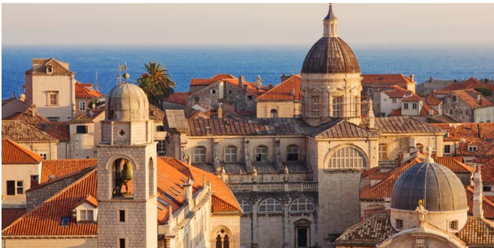
Die Altstadt von Dubrovnik