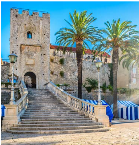
Stadttor von Korčula