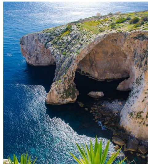
Die Blaue Grotte

der Südküste der Hauptinsel gelegen. Ein wirklich gut erhaltenes Bauwerk mit Orakelnische und Altären und dem größten in Malta verbauten Stein mit einem Gewicht von 60 Tonnen. Neben Einblicken in prähistorische Kultur sollten allerdings auch die Ausblicke nicht fehlen. Marsaxlokk, ein wunderschönes Fischerdorf, malerisch, lebendig und mit typischen maltesischen Fischerbooten geschmückt, wird Sie begeistern. Den Abschluss bildet ein Besuch der zauberhaften Drei Städte – Cospicua (früher Bormla), Senglea (früher Isla) & Vittoriosa (früher Birgu) – drei kleine Hafenstädte von großer Bedeutung und viel älter als Valletta. Unternehmen Sie einen Spaziergang durch Maltas Johanniter Rittergeschichte, die hier begann. Bestaunen Sie ehrwürdige befestigte Doppelmauern, großartige Kirchen, verwinkelte Gassen und typische Balkonfassaden. Vergessen Sie nicht, Ihre Kamera vorher aufzuladen. Sie wird viel zum Einsatz kommen.