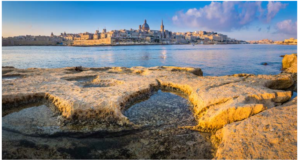
Blick auf Valletta

Unterwegs genießen Sie noch eine kleine maltesische Köstlichkeit: Pastizzi! Zwei Blätterteigtaschen gefüllt jeweils mit Bohnenpüree und Ricottakäse. Dazu gibt es zur Erfrischung eine kleine Flasche Wasser. Es bleibt Ihnen Zeit für ein paar eigene Erkundungen in der verwinkelten Stadt, bevor sie die „Malta