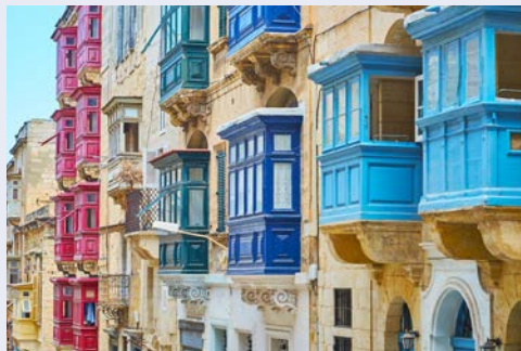
Bunte Fassaden in der Altstadt von Valletta