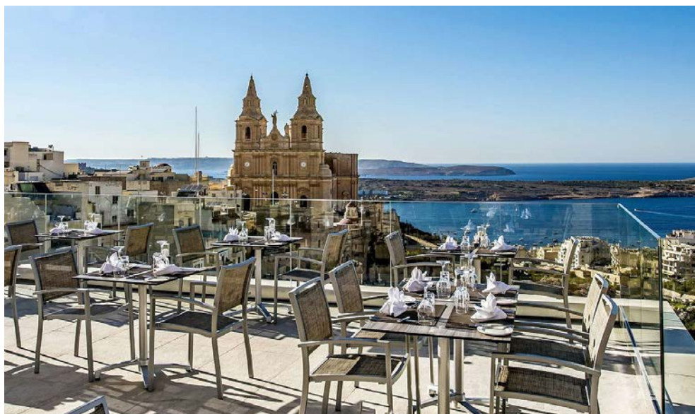
Genießen Sie den Blick von der Dachterrasse

(Ganztagesausflug „Der prähistorische Süden und die Drei Städte“, Ganztagesausflug „Mosta, Mdina mit Premium Weinprobe“, Halbtagesausflug „Maltesischer Palazzo, Mediterrane Gärten & der goldene Sandstrand“, Ganztagesausflug „Grüne „Schwesterinsel Gozo“; alle Ausflüge inkl. Audioguides)