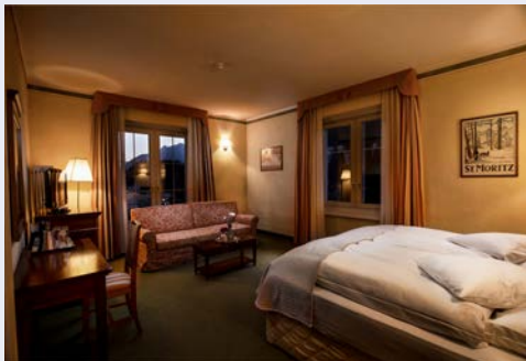
Hotel Reine Victoria in St. Moritz – Zimmerbeispiel

4-Sterne Superior Hotel Reine Victoria in St. Moritz. Königin Victoria von England ist die Namensgeberin dieses gehobenen Jugendstil-Hotels aus dem Jahre 1875. Treten Sie ein in ein Schmuckstück mit allen Annehmlichkeiten. Die besondere Aura des Gebäudes vermittelt sich Ihnen sofort über die Stuckdecken, hohe Spiegel und die vielen Kronleuchter. Elegante Gesellschaftsräume oder das lichtdurchflutete Atrium im 1. Stock tun ein Übriges und sind fürstlicher Rahmen für 141 Zimmer in mehreren Kategorien. Vor den Fenstern lockt die malerische Bergwelt. Frühstücken Sie stilvoll und gemütlich in klassischem Ambiente. Die neue Vic's Bar lädt ein zu Cocktails, Snacks und Tee oder Kaffee.