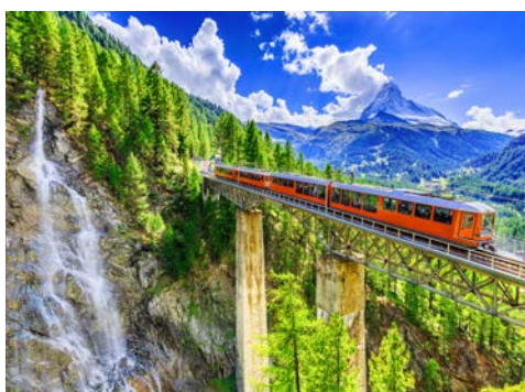
Seit 1898 in Betrieb – die Gornergratbahn

Diese beiden Tage in Zermatt, das 1.620 Meter über dem Meeresspiegel liegt, stehen zur freien Verfügung. Der südlichste Wintersportort der Schweiz ist im Sommer wie im Winter ein beliebtes Urlaubsziel. Das autofreie Dorf liegt zu Füßen einer grandiosen Bergwelt mit einer ganzen Reihe von Viertausendern. Der bekannteste von ihnen ist wohl das Matterhorn mit seinen 4.478 Metern Höhe, das von den