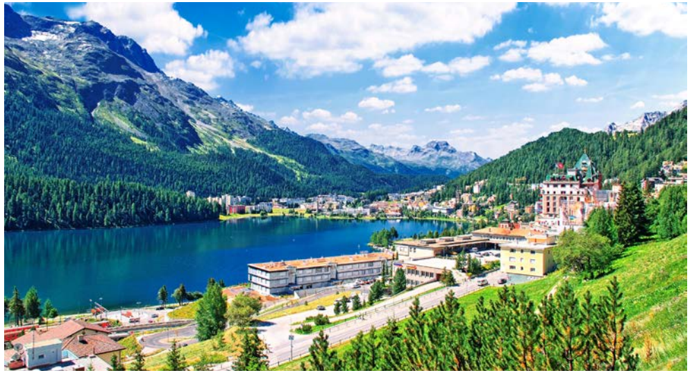
Wunderschön gelegen – St. Moritz

Willkommen in den Schweizer Bergen! Die beliebteste Art die imposante Bergwelt kennenzulernen, ist eine Fahrt mit den berühmten Schmalspurbahnen der Rhätischen Bahn, nämlich mit dem BERNINA- und GLACIER EXPRESS. Durch die Panoramafenster der Großraumwagen bietet sich ein herrlicher Rundblick auf die prächtige Bergwelt der Umgebung. Das Teilstück von Alp Grüm nach Poschiavo etwa, das der BERNINA EXPRESS zurücklegt, zählt zu den schönsten Streckenabschnitten der Schweizer Bahnwelt. Auf seinem Weg nach Tirano überwindet der Zug den 2.253 Meter hohen Bernina-Pass. Auch die Route des GLACIER EXPRESS bietet außergewöhnliche Bahnimpressionen. Seit der Zug am 25. Juni 1930 zum ersten Mal von Zermatt nach St. Moritz fuhr, hat diese Fahrt durch die Schweizer Bergwelt Millionen Reisende fasziniert. Heute ist der Zug die schönste Verbindung zwischen dem vorderen Rheintal, dem Kloster Disentis und der Stadt Andermatt bis zum Wallis mit seinem „Löwen von Zermatt“, dem Matterhorn.