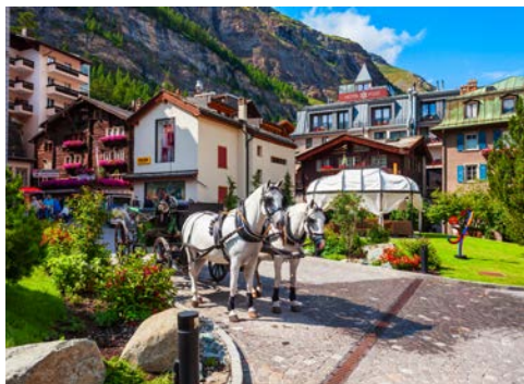
Im Ortskern von Zermatt

auf die überwältigende Natur. Ein weiteres Erlebnis wirft seine Schatten voraus: die Fahrt durch den 15,5 Kilometer langen Furka-Basistunnel, einem der längsten Schmalspurtunnel der Welt. Auf der Fahrt nach Oberwald überwindet der Zug auf der einspurigen Trasse durch den Tunnel fast 200 Höhenmeter. Nach der Ankunft in Zermatt im Kanton Wallis im Süden der Schweiz wird das Gepäck zum Hotel gebracht. Sie selbst gehen gemütlich zu Fuß zum Hotel. Das komplett renovierte Hotel mit der großen Wellness-Oase liegt im Herzen des autofreien Kurortes und garantiert einen erholsamen Urlaub. Die erste elektrisch betriebene Zahnradbahn der Schweiz, die Gornergratbahn, ist eine weitere Attraktion der eidgenössischen Zugwelt. Hinter der Jungfraubahn im Berner Oberland ist sie auch die zweithöchste Bergbahn in Europa. Ganzjährig fährt sie auf 9,4 Kilometern hinauf zum Gebirgskamm des Gornergrats. Die Bahn überwindet ab Zermatt eine Höhe von 1.485 Metern. Dieses Meisterwerk der Technik lässt sich an einem der kommenden zwei Tage in Zermatt erleben.