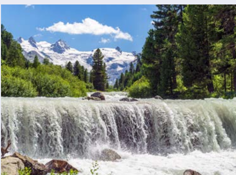
Gletscherbach im Rosegatal mit Piz Glüschaint