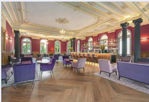
Hotel Reine Victoria in St. Moritz – Vic's Bar