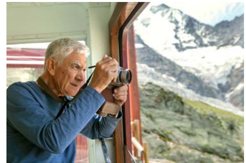
Genießen Sie die Bahnfahrten!

Flug-, Hotel- und Programmänderungen vorbehalten. An- und Abreisetage dienen ausschließlich der Erbringung der vertraglichen Beförderungsleistungen. Je nach Fluggesellschaft und Flugdauer werden Bordverpflegung und Getränke nur gegen Bezahlung angeboten. Stand 02/24 – alle Angaben ohne Gewähr.