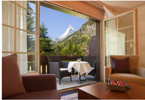
Hotel Le Mirabeau in Zermatt – Impressionen

Das 4-Sterne Le Mirabeau Hotel & Spa in Zermatt ist ruhig aber zentral gelegen, wenige Gehminuten vom Bahnhof und der Gornergrat Station entfernt. Geführt wird das Traditionshaus, welches berühmt für sein französisches Flair und „Art de vivre“ ist, mit viel Herzblut von der dritten Generation der Julien Familie. Das breitgefächerte Serviceangebot bietet von kulinarischen Begegnungen in zwei Restaurants, einer Kaminbar bis hin zum alpin-authentischen Wellness-Angebot ein unvergleichliches Resort-Erlebnis – und immer im Blick; das majestätische Matterhorn. Die Zimmer sind mit traditionellem Filz und Arvenholz gestaltet und bieten schöne Morgensonne mit Blick zum Rothorn und der Mischabel-Bergkette. Die Zimmer sind entweder mit zwei Einzelbetten oder einem Queensize Bett sowie einem Sofa ausgestattet. Modernes Bad mit Dusch-Badewannen Kombination.