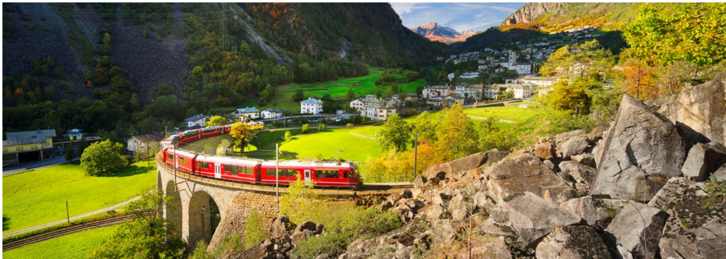
Mit dem BERNINA EXPRESS unterwegs durch die atemberaubende Bergwelt

auf die überwältigende Natur. Ein weiteres Erlebnis wirft seine Schatten voraus: die Fahrt durch den 15,5 Kilometer langen Furka-Basistunnel, einem der längsten Schmalspurtunnel der Welt. Auf der Fahrt nach Oberwald überwindet der Zug auf der einspurigen Trasse durch den Tunnel fast 200 Höhenmeter. Nach der Ankunft in Zermatt im Kanton Wallis im Süden der Schweiz wird das Gepäck zum Hotel gebracht. Sie selbst gehen gemütlich zu Fuß zum Hotel. Das komplett renovierte Hotel mit der großen Wellness-Oase liegt im Herzen des autofreien Kurortes und garantiert einen erholsamen Urlaub. Die erste elektrisch betriebene Zahnradbahn der Schweiz, die Gornergratbahn, ist eine weitere Attraktion der eidgenössischen Zugwelt. Hinter der Jungfraubahn im Berner Oberland ist sie auch die zweithöchste Bergbahn in Europa. Ganzjährig fährt sie auf 9,4 Kilometern hinauf zum Gebirgskamm des Gornergrats. Die Bahn überwindet ab Zermatt eine Höhe von 1.485 Metern. Dieses Meisterwerk der Technik lässt sich an einem der kommenden zwei Tage in Zermatt erleben.