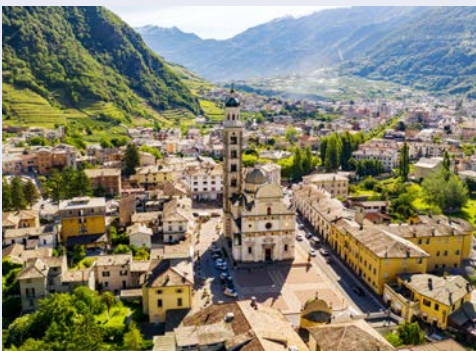
Blick auf Tirano