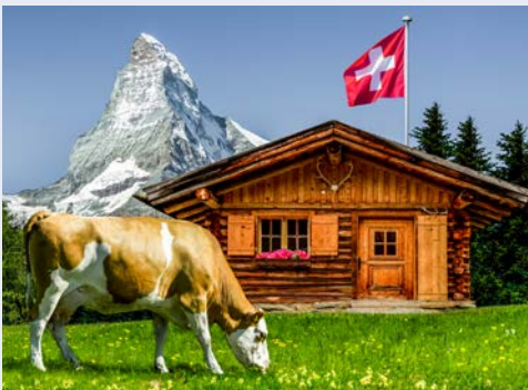
Willkommen in der Schweiz

Die Fahrt im Panoramawagen des „langsamsten Schnellzuges der Welt“ gehört sicherlich zu den Höhepunkten dieser Reise. Während der fast 7,5 Stunden andauernden Bahnfahrt mit dem berühmten GLACIER EXPRESS – benannt nach dem französischen Wort für Gletscher – von St. Moritz nach Zermatt, passiert der Zug 291 Brücken sowie 91 teilweise spiralförmig in den Fels gesprengte Kehrtunnel und überwindet einen Höhenunterschied von nahezu 1.500 Metern. Das Mittagessen wird im Zug eingenommen, mit einem atemberaubenden Ausblick