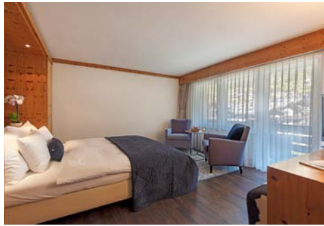
Hotel Le Mirabeau in Zermatt – Zimmerbeispiel