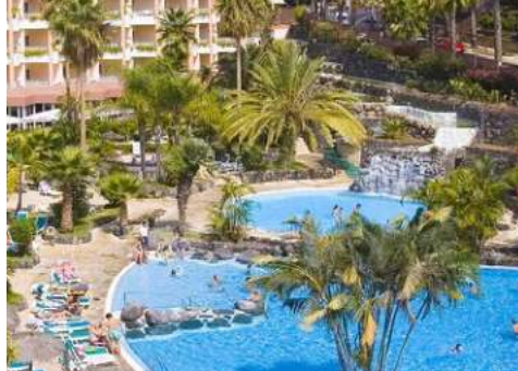
Blick von Ihrem Hotel auf den Pool

Das 4-Sterne Hotel Puerto Palace befindet sich in Puerto de la Cruz im Norden Teneriffas. Von Ihrem Hotel haben Sie einen herrlichem Blick auf das Orotava-Tal, den Teide und den Atlantik. Restaurants, Einkaufs- und Freizeitmöglichkeiten sind in direkter Nähe. Das gemütliche und familiäre Hotel ist seit zwei Generationen unter deutscher Leitung und bietet Ihnen das perfekte Ambiente für Ihren Aufenthalt auf Teneriffa. Die charmant eingerichteten Zimmer verfügen über einen Balkon und einen Minikühlschrank.