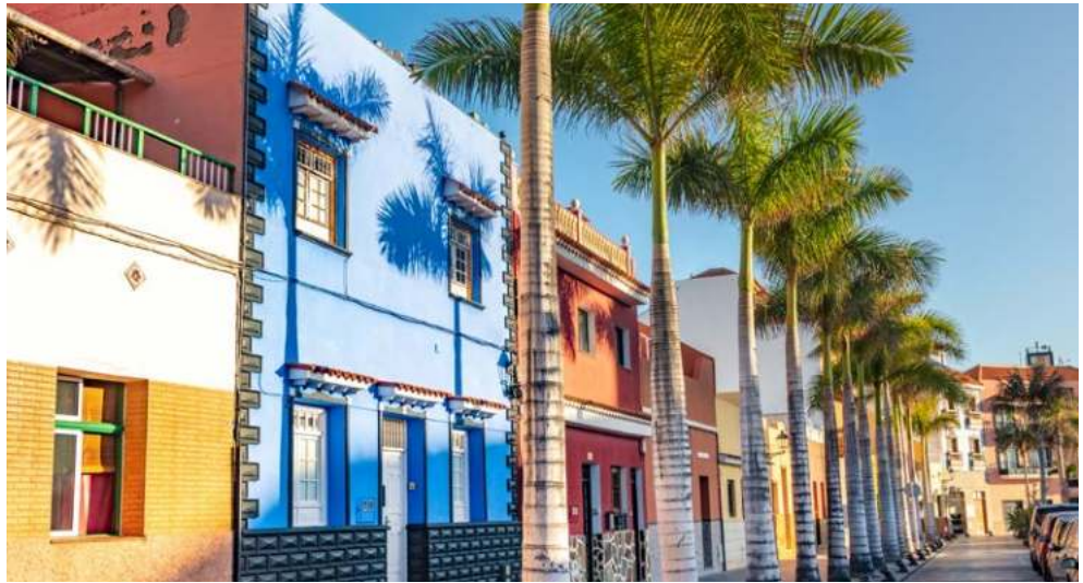
Teneriffa – Puerto de la Cruz

Freuen Sie sich auf eine beeindruckende Reisekombination: Zunächst erleben Sie erholsame Tage in Puerto de la Cruz auf Teneriffa in einem charmanten 4-Sterne Hotel am Atlantik. Mit dem Ganztagesausflug erleben Sie die Inselattraktionen Teneriffas inklusive Tapas Snack. Als nächstes wartet eine abwechslungsreiche Kreuzfahrt mit unvergesslichen Erlebnissen auf Sie: Die Prunkstücke der Kanaren wollen von Ihnen entdeckt werden. Dabei lacht Ihnen die Sonne zu, das Meer wiegt Sie sanft auf Ihrer Sonnenliege oder in Ihrer komfortablen Kabine in den Schlaf. Es wartet eine paradiesische Natur auf Sie mit wunderschönen Stränden und Buchten, zauberhaften Städten sowie einer einmaligen Vegetation. Langeweile kommt auf AIDAcosma garantiert nicht auf, wenn Sie das abwechslungsreiche Showprogramm im Theatrium oder die verschiedenen Sport- und Wellnessangebote wahrnehmen.