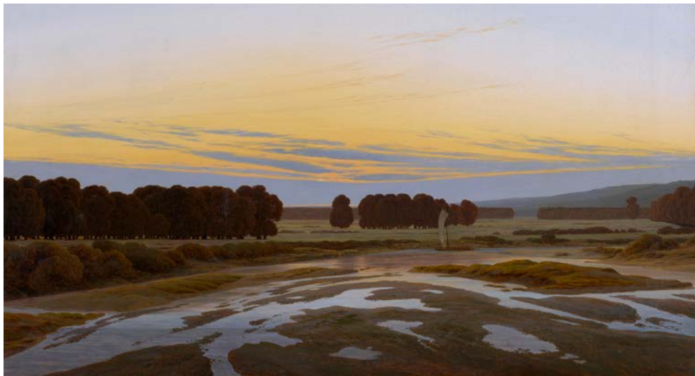
Caspar David Friedrich – Das Große Gehege bei Dresden. 1832, Albertinum

äußerst fein ausgeführt. Sie gewinnen ihre große Strahlkraft aus einer sensiblen Transparenz im Farbauftrag und dem Zauber ihrer Nuancen. In der Ausstellung im Albertinum werden Friedrichs Gemälde den wichtigsten Landschaftsbildern aus der Dresdner Gemäldegalerie Alte Meister gegenübergestellt, die ihn einst inspiriert haben. Diese Landschaften der großen Meister – Jacob Ruisdael, Salvatore Rosa und Claude Lorrain – gehörten schon zu Friedrichs Lebzeiten zu den hoch geschätzten Hauptwerken der Galerie.