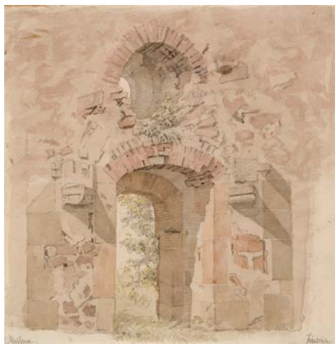
Caspar David Friedrich – Blick aus dem Kapitelsaal der Klosterkirche Heilig Kreuz bei Meißen, um 1824, Kupferstich-Kabinett

Sie schlemmen ausgiebig am reichhaltigen Frühstücksbuffet, bevor Sie um 09.30 Uhr wieder abgeholt werden und auf dem Weg zum Kupferstichkabinett weitere Eindrücke der winterlichen Innenstadt sammeln. Um 11.00 Uhr tauchen Sie in die Welt des Romantikmalers Caspar David Friedrich ein. Über 40 Jahre war Dresden der Lebensmittelpunkt des Malers.