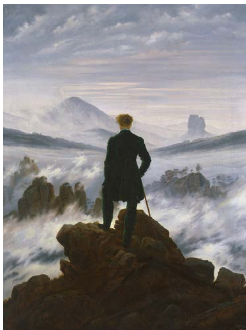
Caspar David Friedrich, Wanderer über dem Nebelmeer, um 1817, Hamburger Kunsthalle, Dauerleihgabe der Stiftung Hamburger Kunstsammlungen

äußerst fein ausgeführt. Sie gewinnen ihre große Strahlkraft aus einer sensiblen Transparenz im Farbauftrag und dem Zauber ihrer Nuancen. In der Ausstellung im Albertinum werden Friedrichs Gemälde den wichtigsten Landschaftsbildern aus der Dresdner Gemäldegalerie Alte Meister gegenübergestellt, die ihn einst inspiriert haben. Diese Landschaften der großen Meister – Jacob Ruisdael, Salvatore Rosa und Claude Lorrain – gehörten schon zu Friedrichs Lebzeiten zu den hoch geschätzten Hauptwerken der Galerie.