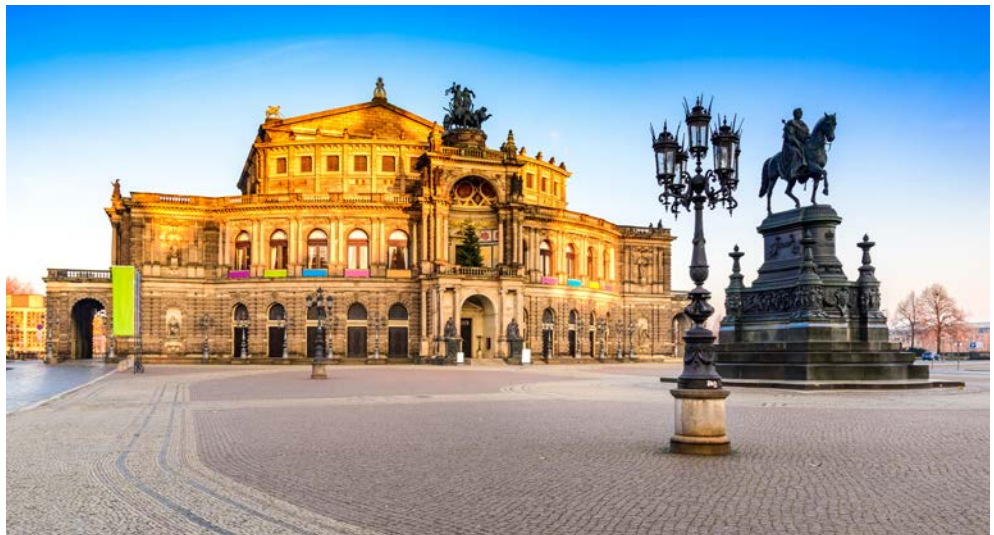
Erleben Sie die Vorstellung "La Traviata" in der Semperoper

In Dresden angekommen, beziehen Sie Ihre luxuriösen Zimmer im Hotel Taschenbergpalais Kempinski Dresden. Im 18. Jahrhundert von August dem Starken als Liebespfand für seine Geliebte erbaut und 1995 restauriert, ist das 5-Sterne Domizil heute eine wunderschöne Kombination aus historischem Glanz und zeitgenössischer Eleganz. Hier lernen Sie um 16.00 Uhr Ihre Gästeführerin kennen, die Sie in den nächsten Tagen begleiten wird. Gemeinsam begeben Sie sich auf einen ersten Spaziergang durch das historische Dresden - entlang aller wichtigen Sehenswürdigkeiten der barocken Innenstadt. Im Anschluss nehmen Sie ab 18.00 Uhr das Abendessen im gediegenen spätbarocken Ambiente des Coselpalais ein. Von hier aus genießen Sie einen einzigartigen Blick auf die weltberühmte Frauenkirche und auf die auf Sandsteinsäulen gestellte kostbarste Kinderputtengruppe des Dresdner Rokoko von G. Knöffel.