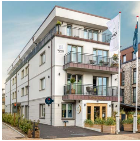
I LOVE SYLT Hotel in Westerland