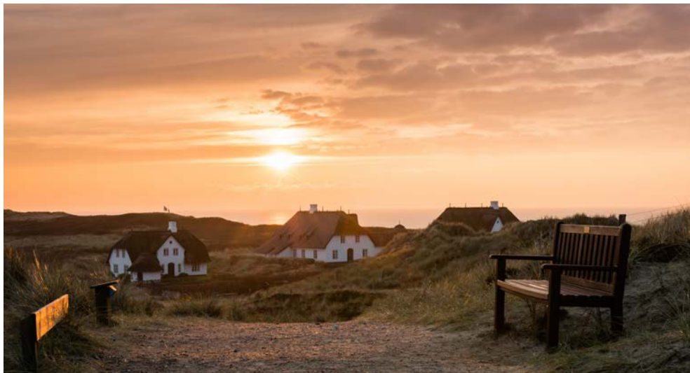
Am Ende der Saison kehrt auf der Insel Ruhe ein