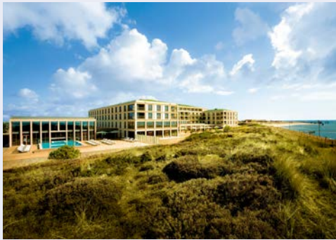
A-ROSA Hotel in List

Erleben Sie Entspannung und Ruhe auf Sylt, fernab vom touristischen Trubel, im exklusiven A-ROSA Hotel. Eingebettet in die traumhafte Sylter Dünenlandschaft direkt an der Nordsee liegt Ihr Urlaubsdomizil in List. Außergewöhnliche Gourmet- und Entspannungs-Erlebnisse werden Sie ebenso verzaubern wie der herrliche Ausblick auf das Wattenmeer und die beruhigende Dünenlandschaft. Ein stilvolles und zugleich modernes Ambiente versprüht eine wohlige Atmosphäre, die die luxuriös eingerichteten Zimmer aufgreifen. Verwöhnen, Vitalisieren und Loslassen. Genau dafür wurde das exklusive SPA-ROSA geschaffen, das sich über zwei Ebenen auf 3.500 m 2 erstreckt und bereits mehrfach prämiert wurde. Sechs verschiedene Saunen und die großzügige Poollandschaft mit beheiztem Innen- und Außenpool u.v.m. versprechen einen fantastischen Urlaub mit besonderen Verwöhnmomenten.