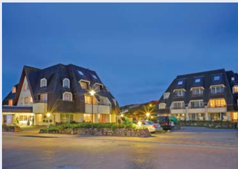
Dorint Strandresort und Spa in Westerland

Wenige Gehminuten vom Strand und Westeralands Zentrum entfernt, befindet sich das Dorint Strandresort und Spa. Sie wohnen in einem gemütlichen Studio mit kombinierbarem Wohn- und Schlafraum. Die Zimmer sind ausgestattet mit einer komfortablen Sitzzecke, Kitchenette, Flachbildschirm und Safe. Entspannen Sie im 800 m 2 großen Spa. Die Erfrischung im Pool, die Wärme und Erholung in den verschiedenen Saunen und Dampfbädern schenken Ihnen neue Energie und Wohlgefühl. Ruheplätze mit Blick auf den im Wind wiegenden Strandhafer laden zum Träumen ein. Lassen Sie sich mit Massagen und Schönheitsanwendungen verwöhnen und entspannen Sie auf der Sonnenterrasse mit Blick auf die Dünen.