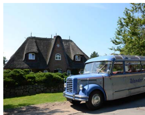
Unterwegs mit dem Oldtimerbus

*Die fakultativen Programmpunkte sind nur bedingt kombinierbar.