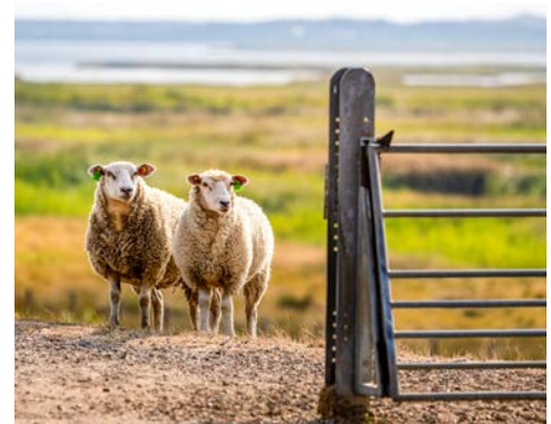
Schafe auf dem Deich, in den Dünen, auf den Wiesen ...

Erleben Sie eine friesische Entdeckungstour auf unserer Inselrundfahrt. Vorbei an gemütlichen, reetgedeckten Friesenhäusern geht die Fahrt in das idyllische Dorf Keitum, welches direkt am Watt gelegen ist. Die kleinen verwinkelten Gassen im historischen Ortskern und die malerischen Häuser laden zum Träumen ein. Bei einem Rundgang erfahren Sie