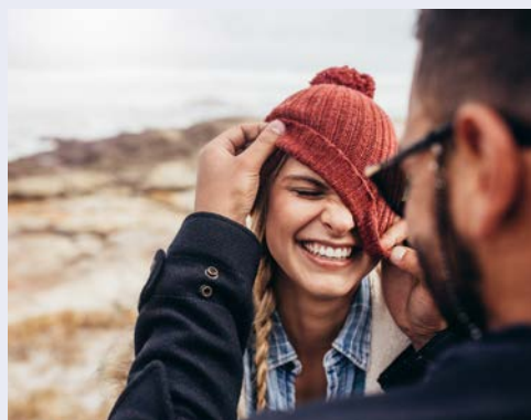
Herrlich – diese Luft!

Wer sich für Wetterereignisse, Watt, Dünen und