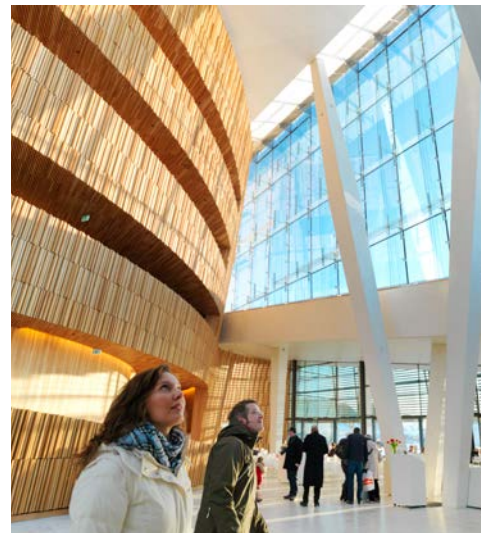
... und von innen faszinierende Ansichten

Nach einem kurzen Fussweg vom Hotel zum Bahnhof, geht es mit dem Flughafenzug Flytoget zum Flughafen Oslo, von wo aus Sie Ihren Heimflug antreten.