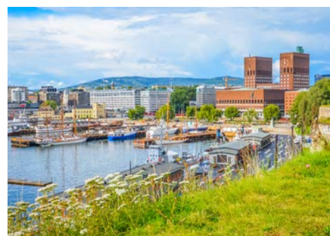
Der Hafen von Oslo mit Blick auf das Rathaus