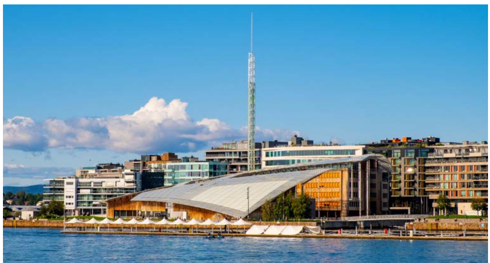
Das Astrup Fearnley Museum