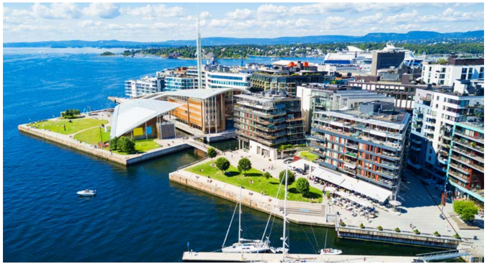
Willkommen in Oslo: Hier trifft moderne Architektur auf viel Natur und Tradition

Willkommen in Oslo! Lassen Sie sich auf dieser Reise verzaubern von historischen Gebäuden, einem lebendigen Hafen und einem besonderen Flair, welcher Sie schnell in Ihren Bann zieht. Bei einer Stadtrundfahrt lernen Sie die schönsten Sehenswürdigkeiten der norwegischen Hauptstadt näher kennen. Oslo ist bekannt für seine vielen Grünanlagen, Cafés, Restaurants und Museen. Und nicht zuletzt verschafft die herrliche Lage am Oslofjord der Stadt ein besonderes Fluidum. Im Anschluss besuchen Sie das neue Munch Museum, mit seinen insgesamt 13 Stockwerken und 11 Galerien ermöglicht das MUNCH unterschiedliche Annäherungsweisen an Munchs Kunst. Im weiteren Reiseverlauf warten das norwegische Nationalmuseum für Kunst, Architektur und Design, wo man u.a. Werke von Van Gogh, Monet, Picasso und Matisse bewundern kann und das Astrup Fearnley Museum auf Sie, welches Zuhause der Astrup Fearnley Sammlung ist und zu den bedeutendsten ihrer Art in Nordeuropa zählt. Abgerundet wird diese kulturelle Reise durch eine Führung im architektonischen Wahrzeichen Oslos, dem spektakulären Operengebäude, sowie einer 2,5-stündigen Bootstour durch den malerischen Oslofjord.