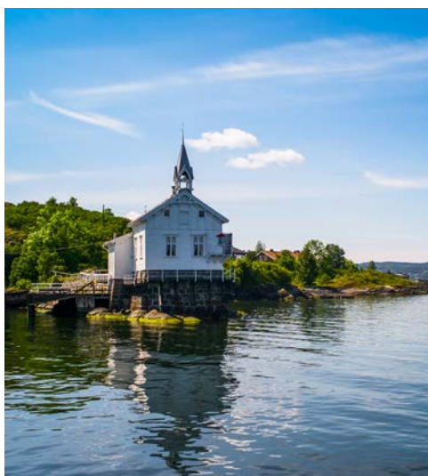
Der idyllische Oslofjord

Ein weiterer Höhepunkt ist der Besuch inklusive Führung im Astrup Fearnley Museum – das Zuhause der Astrup Fearnley Sammlung, einer Sammlung moderner und zeitgenössischer Kunst, die zu den bedeutendsten ihrer Art in Nordeuropa zählt. Im Mittelpunkt steht der Erwerb individueller, innovativer Werke. Ursprünglich dominierten junge amerikanische Künstler, aber nun gehören auch bedeutende Künstler aus Europa, Brasilien, Japan, China und Indien dazu. Wechselnde Ausstellungen ergänzen die Werke der festen Sammlung des Museums. Das Museumsgebäude von 2012 wurde vom italienischen Architekten Renzo Piano entworfen, der für Meisterwerke wie das Centre Georges Pompidou, das Auditorium Parco della Musica und das New York Times Building bekannt ist. Es besteht aus drei Pavillons unter einem markanten Glasdach in Form eines Segels. Das Astrup Fearnley Museum ist vom Tjuvholmen Skulpturenpark umgeben. Nutzen Sie den restlichen Nachmittag und Abend für individuelle Besichtigungen oder einfach nur für einen Einkaufsbummel. Langeweile wird in Oslo sicher nicht aufkommen, da die Stadt so viel zu bieten hat: ein