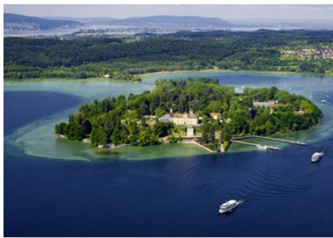
Mainau aus der Vogelperspektive

wo Sie auf einer Backstage-Führung einen Blick hinter die Kulisse der Bregenzer Festspiele werfen können. Auf einem geführten Stadtspaziergang durch die Altstadtgasse von Bregenz lernen Sie die Vorarlberger Landeshauptstadt kennen. Anschließend Rückfahrt nach Lindau, wo Ihnen der Nachmittag für eigene Unternehmungen zur freien Verfügung steht. Nach einem gemeinsamen Abendessen im Hotel legen Sie mit dem Schiff nach Bregenz ab. Ein Sekt-empfang verkürzt Ihnen die Fahrt, bevor Sie auf der OpenAir-Bühne der Bregenzer Festspiele Ihren Platz einnehmen. Lassen Sie sich von imposanter Kulisse und magischem Bühnenbild verzaubern, wenn Carl Maria von Webers „Der Freischütz“ erstmalig auf der Seebühne aufgeführt wird. Per Schiff geht es zurück nach Lindau.