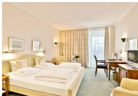
Zimmerbeispiel im Hotel

Genießen Sie ein Getränk an der eleganten Bar oder im Sommer auf der Seeterrasse. Das Spa umfasst Saunen, ein Dampfbad und ein Caldarium. Trainieren Sie im Fitnessstudio oder genießen Sie Schönheitsanwendungen im Spa Maximilian (teilweise gegen Gebühr).