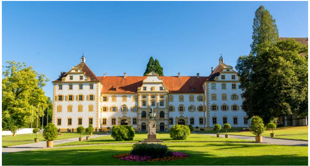
Blick auf Schloss Salem

Durchschreiten Sie sieben Jahrhunderte Architektur auf einem Rundgang durch Kloster und Schloss Salem und erkunden Sie die Lebensweise der ersten Siedler am Bodensee im historischen Pfahlbauten-Museum. Lassen Sie sich von der üppigen farbenprächtigen Pflanzenwelt auf der Insel Mainau verzaubern, erfahren Sie mehr über den unvergleichbaren Pioniergeist von Claude Dornier und lassen Sie sich auf einem Weinspaziergang durch die südlichste Weinregion Deutschlands in die über jahrhundertalte Weinbaugeschichte entführen.