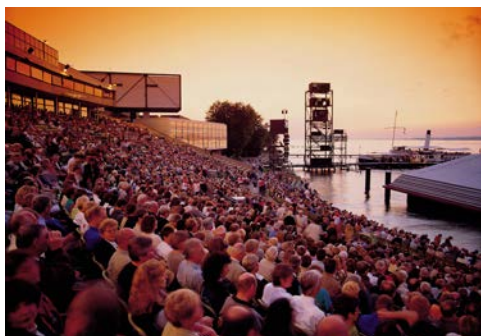
Unvergleichlich – diese Atmosphäre bei den Festspielen

Der heutige Tag steht ganz im Zeichen der Bregenzer Festspiele. Am Vormittag fahren Sie nach Bregenz,