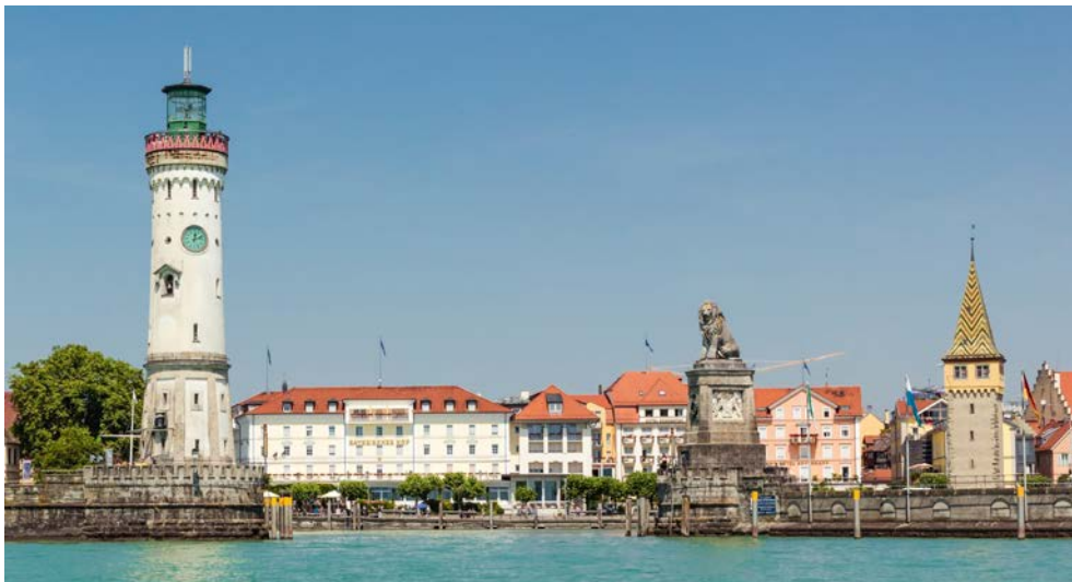
Blick auf das Hotel Bayerischer Hof