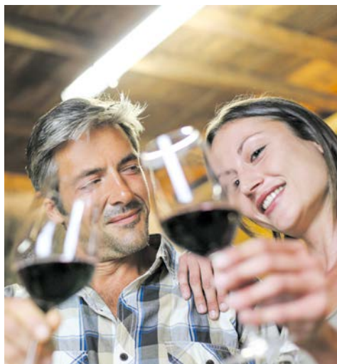
Kosten Sie Weine vom Bodensee

Flug nach Zürich. Am Flughafen werden Sie von Ihrer örtlichen Reiseleitung in Empfang genommen. Im Anschluss fahren Sie nach Lindau am Bodensee, wo Sie für die nächsten 4 Nächte Ihr Hotel beziehen. Ein geführter Abendspaziergang durch Lindau beschließt Ihren Tag.