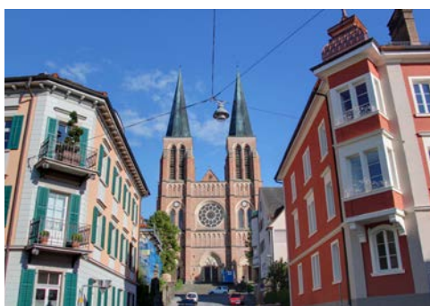
In der Altstadt von Bregenz