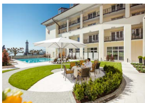
Hotel Bayerischer Hof