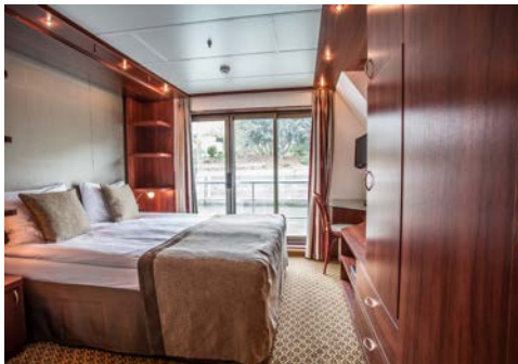
Kabinenbeispiel mit frz. Balkon

Bordsprache: Bei diesem Schiff handelt es sich um ein internationales Flusskreuzfahrtschiff. Daher können nicht