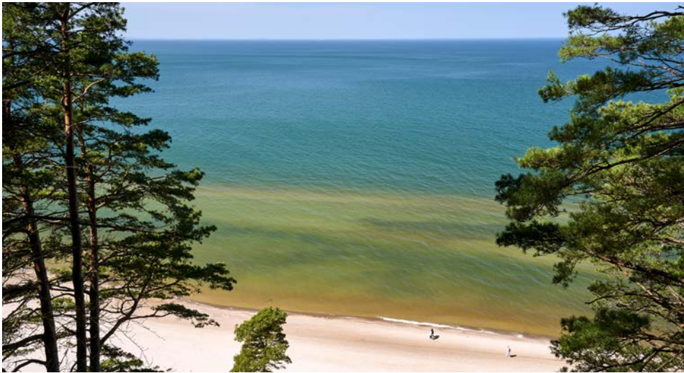
Karibische Farben auf der Insel Wollin

der Gründerzeit erfreut sich heutzutage wieder großer Beliebtheit. Außerdem kommen Sie vorbei an dem idyllischen Türkissee und an der Stadt Lubin. Seit dem 2. Weltkrieg gehört Lubin zu Polen und ist einer der größten Industriestandorte in Niederschlesien. Lubin begeistert die Besucher durch ihre lange zurückliegende Geschichte, die vor allem an dem historischen Ortskern deutlich wird. Genießen Sie anschließend das Mittagessen und Ihren Nachmittag auf dem Sonnendeck, während das Schiff um 15.30 Uhr von Swinemünde nach Wolgast fährt, wo es gegen 23.00 Uhr ankommt. Lassen Sie Ihren Abend beim Abendessen und anschließend in der Lounge oder auf dem Sonnendeck in gemütlicher Runde ausklingen.