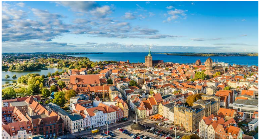
Blick über Stralsund

Einige Stopps dienen nur der Ausflugsabwicklung