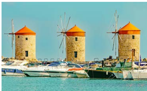
Hafen von Rhodos Stadt

Ort Filerimos, mit der Akropolis des antiken Ialissos. Danach geht es in das Tal der Schmetterlinge, welches nach den vielen Faltern benannt wurde, die im Juli zu Millionen die Gegend bevölkern. Dort unternehmen Sie eine kleine Wanderung durch die beeindruckende Schlucht. Unterwegs entspannen Sie sich in einer Taverne bei einem landestypischen Meze-Mittagessen und einem Gläschen Ouzo. Abschließend besuchen Sie die antike Stadt Kameiros, bei der Sie Relikte aus dem 6. Jh. v. Chr. besichtigen können. Der Rest des Tages steht Ihnen zur freien Verfügung.