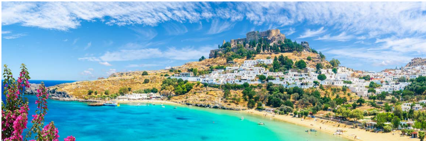
Blick auf die weiße Stadt Lindos