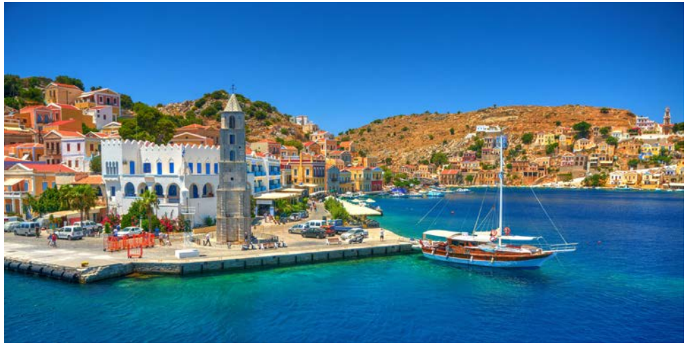
Die Insel Symi

Wer kennt nicht den berühmten „Koloss von Rhodos“, eines der sieben Weltwunder des Altertums. Er schmückte die Hafeneinfahrt der Hauptstadt und war ein Symbol für die Macht der Insel in der Antike. Heute ist Rhodos eine beliebte Urlaubsinsel und bietet neben strahlendem Sonnenschein auch kulturelle Höhepunkte und landschaftliche Schönheiten. Genießen Sie ein paar unvergessliche Tage und lassen Sie sich von der griechischen Gastfreundschaft verwöhnen.