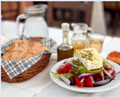
Griechische Küche – einfach lecker!

Frühstück im Hotel, anschließend nehmen Teilnehmer des Ausflugspaketes an dem Ausflug zur Insel Symi