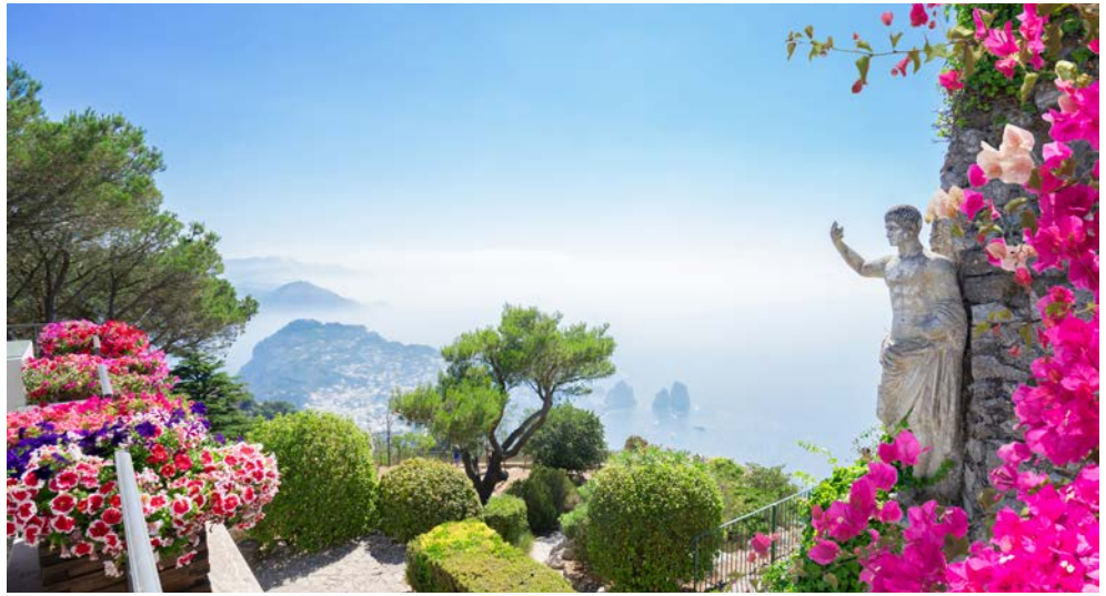
Capri – traumhafte Aussichten von den Augustusgärten

Seit Jahrhunderten inspiriert die Schönheit des Golfs von Neapel Literaten und Musiker aus ganz Europa. Die einzigartige Kulturlandschaft besticht durch prachtvolle Blütengärten, bizarre Felsformationen und ein azurblaues Meer. Verschlungene Küstenstraßen führen durch Orangen- und Zitronenhaine zu Stätten antiker Geschichte. Kampanische Bauern bewirtschaften ihre Gärten und Höfe in der zerklüfteten Küstenlandschaft seit Generationen. Ob Mozzarella oder Limoncello, hier kommen die Gaben der Natur direkt auf den Tisch. Über all dem thront der Vesuv, sagenhafter Mythos und Ehrfurcht erregende Naturgewalt. Idealer Ausgangspunkt, um diesen reizvollen Landstrich Kampaniens intensiv zu erkunden, ist Sorrent. Ein malerischer Ort, der imposant auf einem Felsplateau liegt. Ganz in der Nähe gründeten die Römer die mondäne antike Stadt Pompeji, deren durch Asche konservierte Architektur die Besucher noch heute in die untergegangene Kultur eintauchen lässt. Spätere Könige, Päpste und Fürsten prägten mit dem Bau gotischer Kirchen und barocker Prachtbauten die Altstadt von Neapel. In kleinen Bergdörfern überdauerten zudem die Bauwerke der Normannen und Mauren die Jahrhunderte. Und auf der wohl schönsten Insel des Tyrrhenischen Meeres, auf Capri, finden sich bis heute Spuren früher Bewunderer der einzigartigen Natur. Hier verbrachten im 19. Jahrhundert sowohl der schwedische Schriftsteller Axel Munthe als auch der deutsche Industrielle Friedrich Alfred Krupp ihre wohl schönsten Lebensjahre.