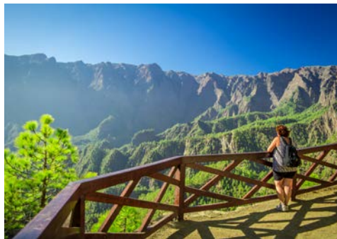
Der Mirador de la Cumbrecita

Nach dem Frühstück beginnen Sie den heutigen Ausflug ins Innere der Insel. Die Fahrt führt Sie zunächst erst einmal über den Bergkamm auf die Westseite der Insel. Hier halten Sie in El Paso, am Besucherzentrum des Nationalparks. Der Mirador de la Cumbrecita im