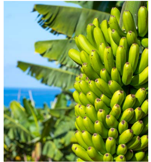
Bananenplantagen mit Meerblick