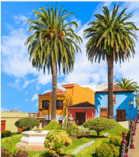
Impressionen in La Orotava