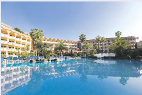
Hotel Puerto Palace in Puerto de la Cruz, Teneriffa

Das 4-Sterne Hotel Puerto Palace befindet sich in einer ruhigen Wohngegend in Puerto de la Cruz im Norden Teneriffas, zu Füßen des Valle de la Orotava. Restaurants, Einkaufs- und Freizeitmöglichkeiten sind in direkter Nähe. Das gemütliche und familiäre Hotel ist seit zwei Generationen unter deutscher Leitung und bietet Ihnen das perfekte Ambiente für Ihren Aufenthalt auf Teneriffa.