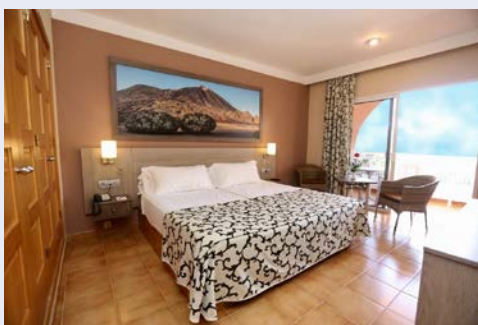
Zimmerbeispiel im Hotel Puerto Palace