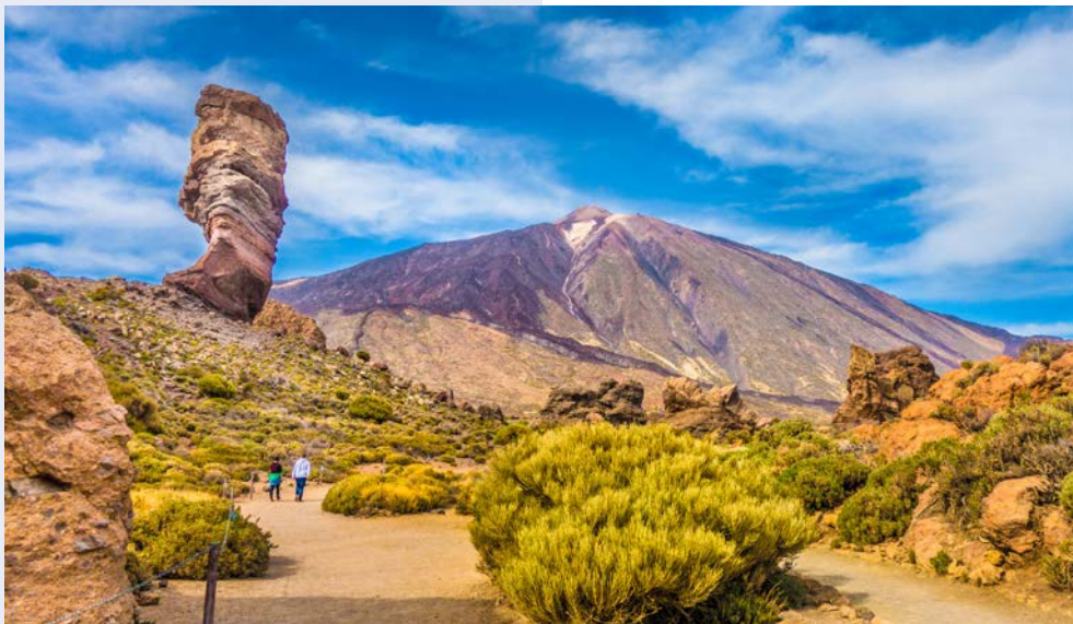
Der Teide auf Teneriffa