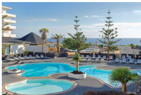
Hotel H10 Taburiente Playa, La Palma

Das 4-Sterne Hotel H10 Taburiente Playa liegt direkt am Meer, nur 300 m vom bekannten Playa de los Cancijos entfernt. Zu den Highlights zählen die komfortablen Zimmer, Swimmingpools und Terrassen mit spektakulärem Meerblick sowie das vielfältige gastronomische Angebot mit typischen Produkten der Kanarischen Inseln.