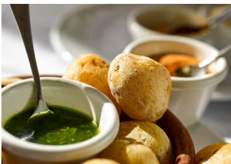
Ein köstlicher Klassiker – Kartoffeln mit „mojo verde“

Frühstück im Hotel. Transfer zum Flughafen Teneriffa-Nord und Flug nach La Palma. Santa Cruz de La Palma ist eine kleine Perle im Atlantik, die heutzutage von vielen Kreuzfahrtschiffen angesteuert wird. Diese kleine historische Hafenstadt die zur Zeit der ersten Kolumbus Reisen in die Neue Welt gegründet wurde, diente als Brücke zwischen Europa, Afrika und Amerika. Die Stadt ist eng mit der Geschichte des spanischen Königreiches und der Kolonialzeit verbunden. Das hat Spuren hinterlassen: Es gibt viele alte Gebäude, welche die Geschichte der Insel und die Geschichte ihrer Besitzer – seien es Händler, Angestellte, Kirchenmitglieder oder Schiffsagenten – erzählen. Sie werden viele schöne enge Gassen, die einst gegen Piratenangriffe schützten, und bunte Fassaden sehen. Bei dieser Halbtagestour werden Sie in das quirlige Leben dieser kleinen Metropole eintauchen. Der Nachmittag steht dann zur freien Verfügung, Abendessen im Hotel.