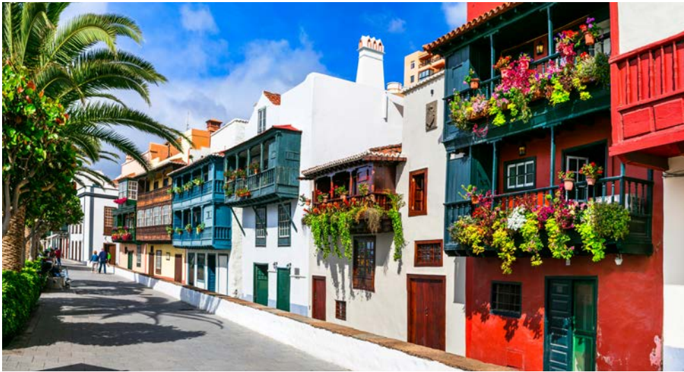
Santa Cruz de La Palma