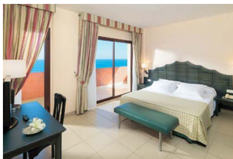
Zimmerbeispiel im Hotel H10 Taburiente Playa

Die großen, hellen Zimmer im H10 Taburiente Playa sind komplett mit allen Annehmlichkeiten ausgestattet.