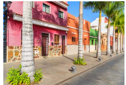
Puerto de la Cruz

und zentrale Platz ist die Plaza del Charco, die direkt am Hafen gelegen ist. Die historische Altstadt von Puerto de la Cruz ist nur wenige Gehminuten entfernt. Anschließend unternehmen Sie noch einen Abstecher in das oberhalb von Puerto gelegene La Orotava mit seinen edlen Adelshäusern, dem Stadtpalais und den typischen kanarischen Holzbalkonen. Diese historische Altstadt steht unter Denkmalschutz. Der Nachmittag steht Ihnen dann zur freien Verfügung, Abendessen im Hotel.