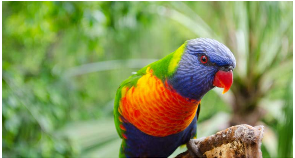
Mit etwas Glück sehen Sie einen dieser bunten Papageien