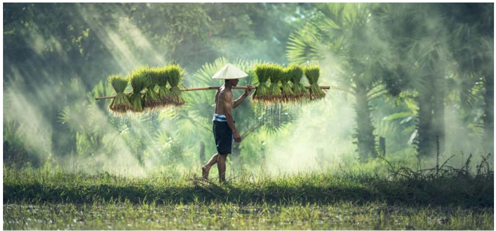
Ganz traditionell – ein Reisfarmer in Laos