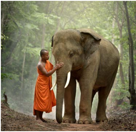
Budhistischer Mönch in Laos

feilgeboten wird. Achtung, der Besuch ist nur etwas für starke Mägen! Der restliche Tag steht Ihnen für eigene Streifzüge zur Verfügung. Erkunden Sie die Gegend zu Fuß oder mit dem Miet-Fahrrad. Sie können auch einen Einkaufsbummel unternehmen, das Flair der Stadt in einem der zahlreichen Cafés aufsaugen oder einen Ausflug in die Umgebung machen. Anschließend nehmen Sie an einer traditionellen laotischen Baci-Freundschafts-Zeremonie teil, untermauert mit klassisch laotischer Musik und Tanz. (F/A)