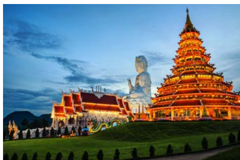
Chiang Rai – Wat Huai Pla Kung Temple

Nach dem Frühstück fahren Sie in die berühmteste Region des Goldenen Dreiecks. Sie überblicken zusammen mit dem Goldenen Buddha am Fuße des Tempelbergs die Grenzregion zwischen Thailand, Myanmar und Laos und besuchen die Hall of Opium, die die Geschichte des heute verbotenen Opium-Anbaus erzählt. Am Abend heißt Sie die Crew an Bord Ihres Flusskreuzfahrtschiffs Mekong Pearl herzlich willkommen. Sie beziehen Ihr komfortables schwimmendes Zuhause für die kommenden zehn Nächte. (F/M/A)