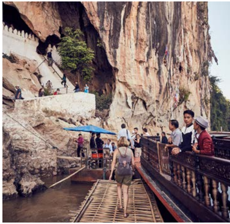
Die Pak-Ou Höhlen

Lehnen Sie sich zurück und genießen Sie bequem vom Sonnendeck oder von Ihrer Kabine aus die eindrucksvollen Flusspanoramen am Mekong. Bei gutem Wetter können Sie heute wieder eine kurze Wanderung zu noch weitgehend unentdeckten Höhlen unternehmen. In Ihrer Freizeit können Sie auf dem Sonnendeck entspannen oder den kurzweiligen Bordvorträgen lauschen. Auf unterhaltsame Weise erfahren Sie auch Details zur Geschichte von Laos und seiner Bevölkerung. Vielleicht möchten Sie ja auch an einer Obstverkostung an Bord teilnehmen? (F/M/A)