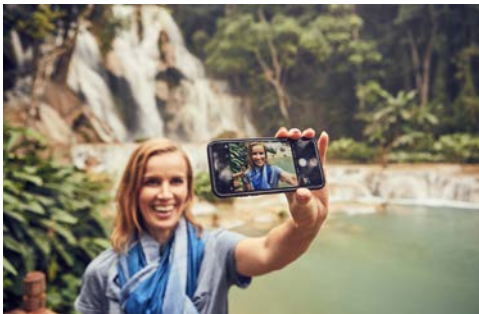
Die Wasserfälle von Kuang Si

Heute besuchen Sie einen bei den Einheimischen sehr beliebten Park mit den malerischen Kuang Si-Wasserfällen. Die türkisblauen Pools zwischen den einzelnen Kaskaden inmitten der üppig-grünen Vegetation laden vor allem an heißen Tagen zu einem erfrischenden Bad ein. Ihr Schiff schlängelt sich dann weiter südwärts. Sie passieren per Schleuse eines der größten Bauprojekte in Laos, den imposanten Staudamm bei Xayaburi. Abends ankert Ihr Flusskreuzfahrtschiff an einer Sandbank oder am Ufer, wo Sie Ihr Abendessen an Bord inmitten ursprünglicher Natur genießen. (F/M/A)