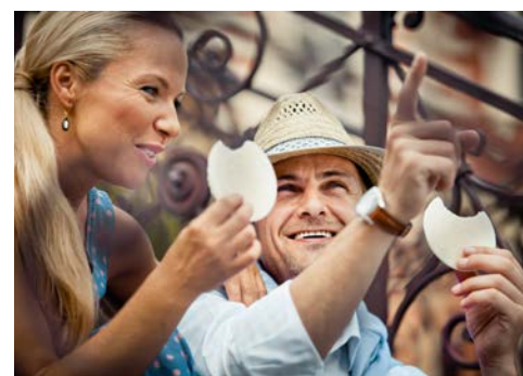
Kolonada Oblaten aus Marienbad