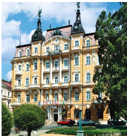
Health Spa Hotel - Ensana Pacifik