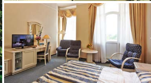
Health Spa Hotel - Ensana Pacifik, Zimmerbeispiel