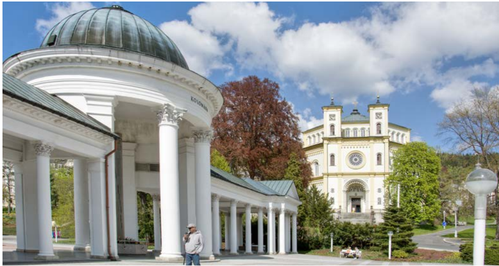
Kolonnade der Karolinenquelle