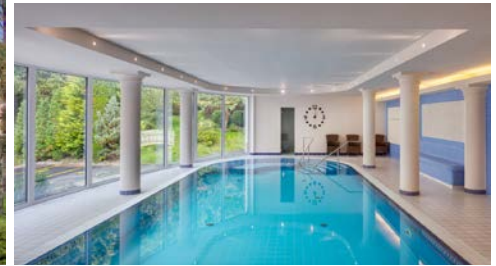
Hotel Olympia – Zimmerbeispiel, Reha-Bassin