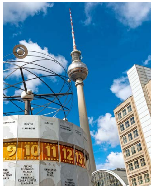
Weltzeituhr und Fernsehturm auf dem Alexanderplatz

Sie genießen noch einmal ausgiebig das reichhaltige Frühstücksbuffet Ihres Luxushotels, bevor sich das Team des Adlon Hotels von Ihnen verabschiedet und Sie nach etwas freier Zeit ab 11 Uhr Ihre Fahrt nach Hause antreten.