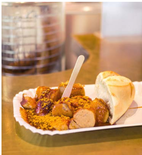
Die Currywurst – ein Klassiker!

Bekanntheit erlangte Köpenick durch die Geschichte vom falschen Hauptmann, dem Sie hier begegnen. Eine Bronzestatue und eine Gedenktafel am Köpenicker Rathaus erinnern an die einstige Hochstapelei. Das mächtige Rathaus mit seinem 54 Meter hohen Turm wurde im 17. Jahrhundert im Stil der Backsteingotik erbaut. Nach dem Rundgang bringt Sie der Bus entlang des Wassers zum Yachthafen Wendenschloss. Auf dem Gelände befindet sich ein gemütliches Restaurant und in der Fischerstube wird Ihnen ein leckeres Buffet inklusive Getränken serviert.