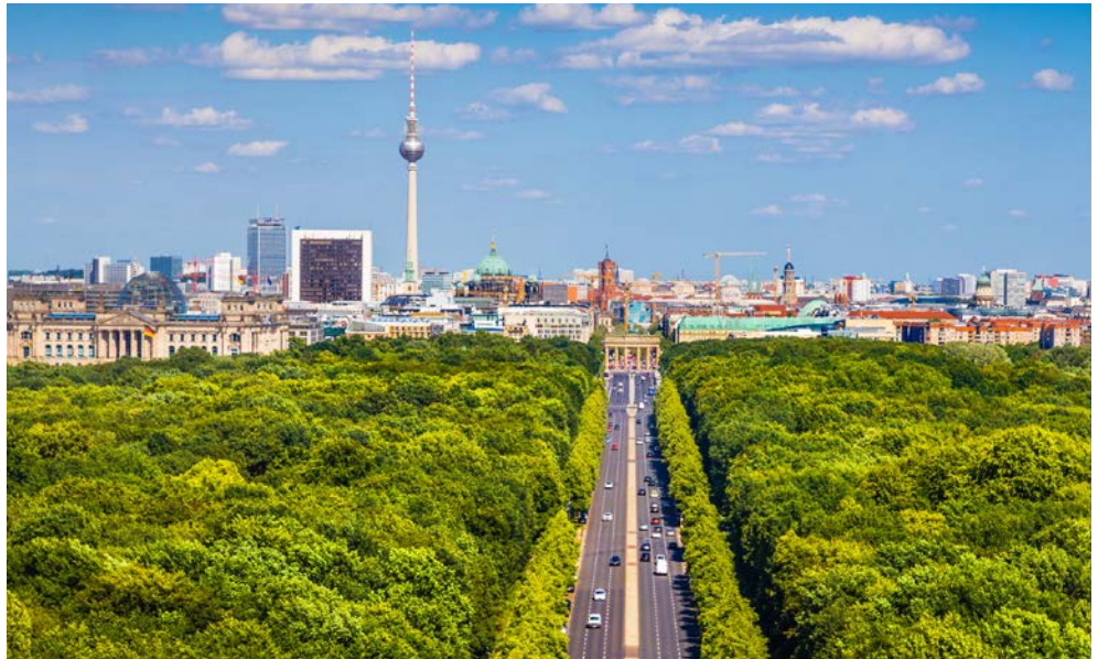
Willkommen in der Weltstadt Berlin

Das Hotel Adlon ist eines der luxuriösesten und bekanntesten Hotels in ganz Deutschland. Die direkt an Berlins berühmtestem Wahrzeichen, dem Brandenburger Tor, gelegene Hotel-Ikone spiegelt Luxus, Stil und Eleganz der Extraklasse wider. Verbinden Sie einen Aufenthalt in dieser Hotellegende mit einem Ausflug in die sommerliche Hauptstadt. Berlin hat immer etwas zu bieten, denn die kontroverse Weltmetropole hat viele Gesichter, und ist ein moderner Schmelztiegel vieler Kulturen und mehr denn je Anziehungspunkt für Besucher weltweit. Außerdem besuchen Sie die aktuelle Show FALLING IN LOVE im Friedrichstadt-Palast – kuratiert von niemand anderem als dem Modedesigner Jean-Paul Gaultier.