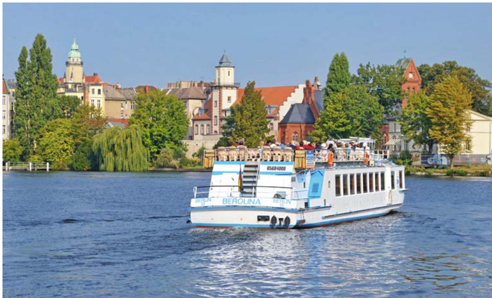
Schiffsfahrt auf dem Müggelsee

Bekanntheit erlangte Köpenick durch die Geschichte vom falschen Hauptmann, dem Sie hier begegnen. Eine Bronzestatue und eine Gedenktafel am Köpenicker Rathaus erinnern an die einstige Hochstapelei. Das mächtige Rathaus mit seinem 54 Meter hohen Turm wurde im 17. Jahrhundert im Stil der Backsteingotik erbaut. Nach dem Rundgang bringt Sie der Bus entlang des Wassers zum Yachthafen Wendenschloss. Auf dem Gelände befindet sich ein gemütliches Restaurant und in der Fischerstube wird Ihnen ein leckeres Buffet inklusive Getränken serviert.