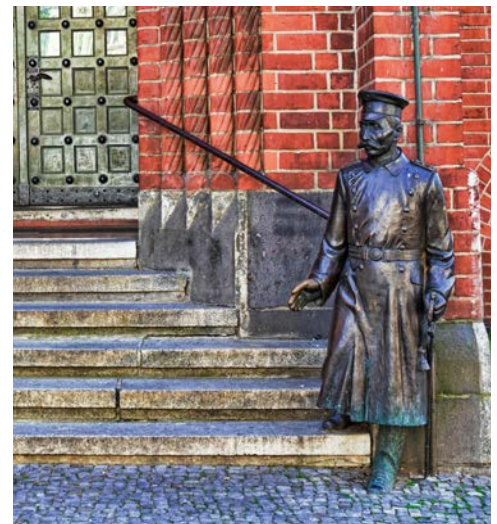
Hauptmann von Köpenick

wichtigsten Wahrzeichen deutscher und europäischer Einigung. Am Ende des Rundganges wird Ihnen ab 19 Uhr ein Abendessen in einem Traditionsrestaurant Unter den Linden serviert.