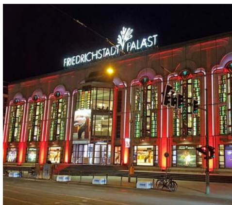
Freuen Sie sich auf eine Show im Friedrichstadt-Palast

Platz gebracht und genießen den Ausblick bei einem Glas Sekt und einer Berliner Currywurst. Nach der Rückkehr ins Hotel gegen 14 Uhr steht der restliche Nachmittag für eigene Erkundungen zur Verfügung. Genießen Sie Ihr Luxushotel und die einmalige Lage am Brandenburger Tor. Um 17:30 Uhr werden Sie in der Nolle zu einem Abendessen erwartet. Unter der sechs Meter hohen, gewölbten Decke des S-Bahnbogens hat sich hier ein stilvolles Ambiente für feine und rustikale Gaumenfreuden etabliert. Der Stil der 20er Jahre und traditionelle Gastlichkeit finden sich hier seit über 100 Jahren. Im Anschluss gehen Sie in den benachbarten Friedrichstadt-Palast und sehen die aktuelle Show FALLING IN LOVE. Die spektakuläre Show verspricht eine Explosion der Farben – kuratiert vom Pariser Stardesigner Jean Paul Gaultier. Es ist Berlins strahlendstes Show-Juwel mit der Magie von abertausenden Swarovski-Kristallen. Tauchen Sie ein in eine blühende Fantasie, wenn über 100 Künstlerinnen und Künstler auf der größten bespielbaren Theaterbühne der Welt das Leben zelebrieren.