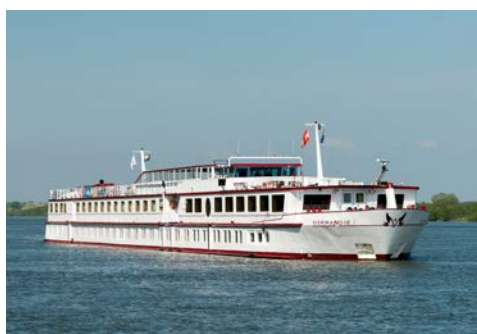
Die NORMANDIE begleitet Sie