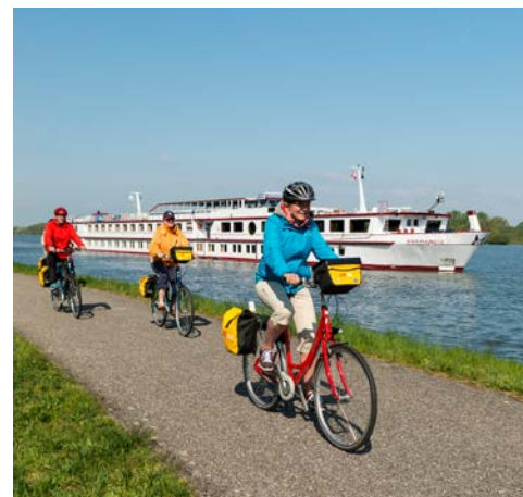
Freuen Sie sich auf die schönen Radtouren

Heute erwartet Sie eine sehr abwechslungsreiche und interessante Tour. Von Gorinchem radeln Sie über Leerdam – bekannt durch den Leerdamer Käse – in die Festungsstadt Vianen. Hier sollten Sie eine kurze Pause in einem der zahlreichen Straßencafés einlegen. Mit der Fähre setzen Sie über den Lek und radeln weiter nach Vreeswijk mit seinen engen Gassen. Weiter geht es über die kleine Stadt Nieuwegein – vielleicht statten Sie dem Fort Jutphaas, das versteckt in einer grünen Oase in Nieuwegein gelegen ist,