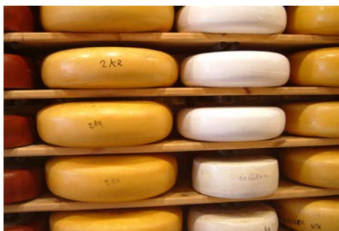
Käse aus Gouda – ein Genuss!

Heute Morgen sollten Sie sich unbedingt noch etwas Zeit für das lebendige Städtchen Utrecht nehmen, bevor Sie wieder aufs Rad steigen. Im Anschluss Tour durch das schöne Polderland über Oudewater mit seinem bekannten Hexen-Waaghaus (keine der so genannten Hexen, die hier gewogen wurden, wurde jemals zu leicht befunden und verurteilt) in die Silberstadt Schoonhoven mit ihrer typisch holländischen Altstadt.