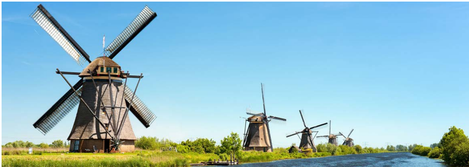
Die berühmten Windmühlen von Kinderdijk