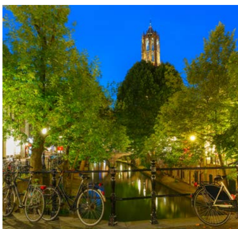
Dom und malerische Grachten in Utrecht

noch einen kurzen Besuch ab, bevor Sie Utrecht erreichen. Utrecht gilt als das Herz Hollands. Die Stadt wurde rund um den Dom herum erbaut. Damit ist es praktisch unmöglich, sich in der verkehrsberuhigten Innenstadt mit den idyllischen Grachten zu verlaufen.