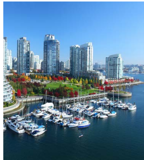
Die Skyline Vancouvers