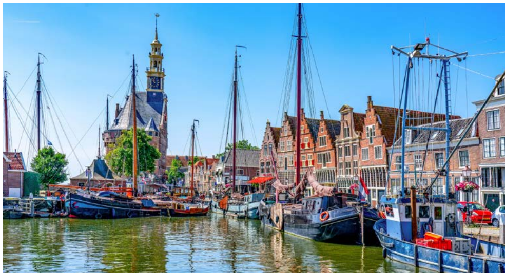
Alter Hafen von Hoorn