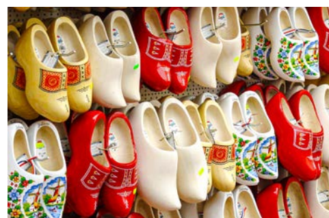
Erfahren Sie mehr über holländischen Käse und Holzschuhe