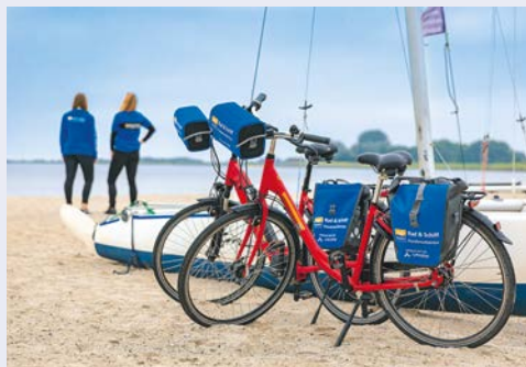
Unterwegs mit dem Mietfahrrad

Einige Stops dienen der Ausflugsabwicklung