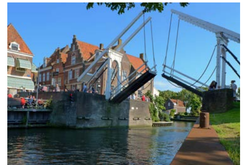
Klappbrücke in Enkhuizen