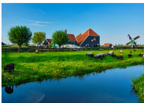
Zaanse Schans – Ein Besuch ist lohnenswert