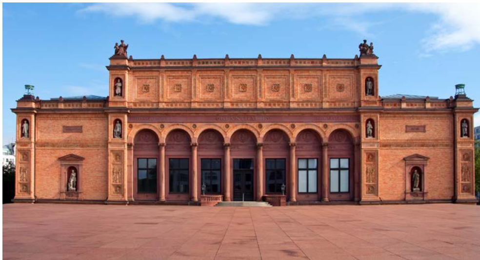
Die Hamburger Kunsthalle

Alten Meister bis in die Gegenwart, steht die Frage nach der Definition und Dehnbarkeit des Begriffs „Illusion“ und damit einhergehend eine neue Bewertung der illusionistischen Malerei, die von der Realität nicht mehr zu unterscheiden ist. Angesichts der Macht illusionistischer Bilder wirft die Ausstellung vor dem Hintergrund von Fake News und künstlicher Intelligenz auch ein Schlaglicht auf unsere Gesellschaft im 21. Jahrhundert. Sie haben genügend Zeit, sich in aller Ruhe umzuschauen oder einen Mittagsimbiss einzunehmen, denn das Hotel liegt fußläufig entfernt.