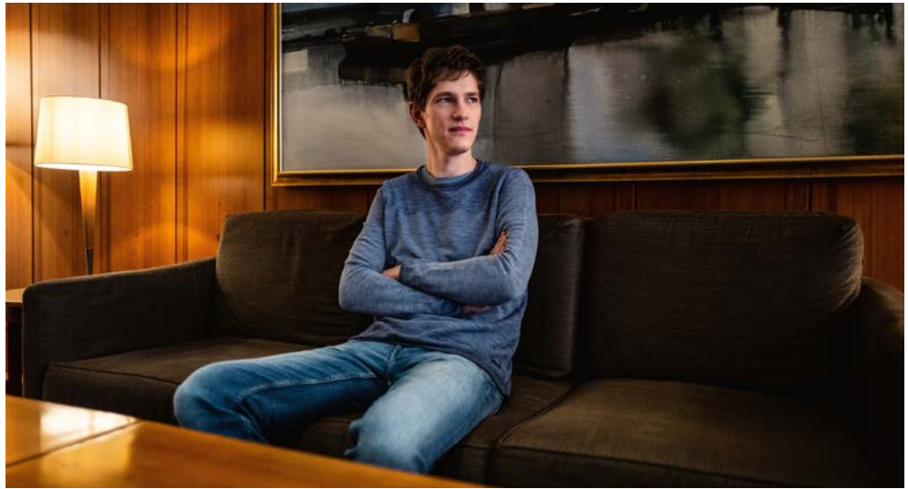
Der Ausnahme-Pianist Jan Lisiecki

Der Besuch eines Konzerts in der Elbphilharmonie ist immer wieder ein herausragendes Erlebnis. Das ikonische Konzerthaus, das am 11. Januar 2025 seinen 8. Geburtstag feiert, ist das strahlende Wahrzeichen Hamburgs und der unangefochtene Stern am hansestädtischen Kulturhimmel. Seien Sie dabei, wenn die ersten Takte, Rhythmen und Akkorde von der Mitte der Bühne aus ihren klangvollen Weg durch die wie ein Weinberg angelegten Zuschauerreihen finden und dem großen Konzertsaal musikalisches Leben einhauchen. Dazu erwartet Sie Hamburg mit einem abwechslungsreichen Rahmenprogramm rund um die Elbphilharmonie und das UNESCO Welterbe Speicherstadt, denn „Das Tor zur Welt“ ist zu jeder Jahreszeit eine Reise wert.