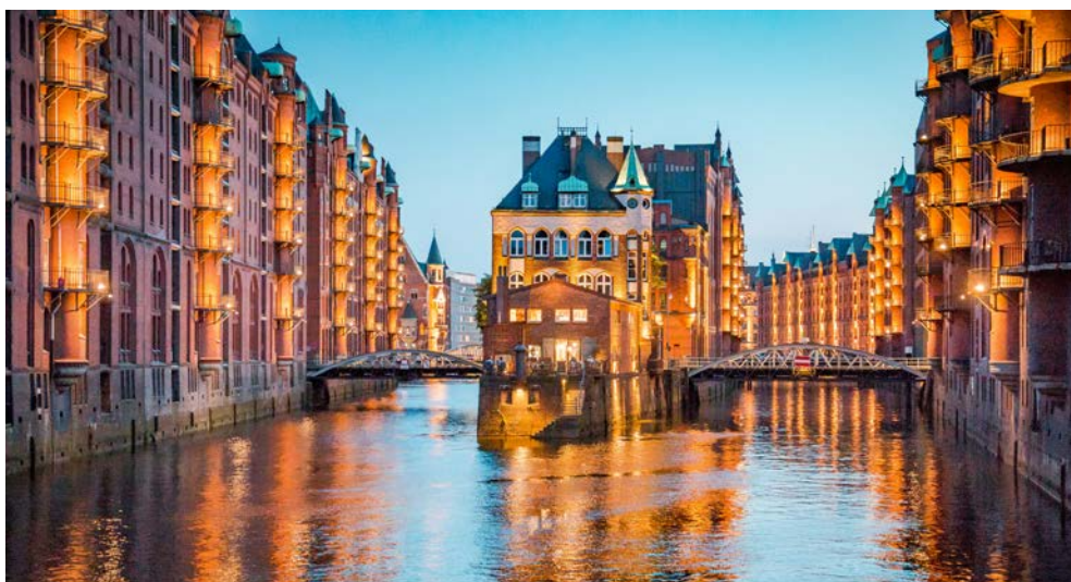
In der Speicherstadt

Nach 90 Minuten haben Sie wieder festen Boden unter den Füßen und werden um 20 Uhr zum Abendessen in einem der schönsten und meistfotografierten Gebäude der Speicherstadt erwartet. Schon immer war das WASSERSCHLOSS aufgrund seiner außergewöhnlichen Lage und der besonderen Architektur ein ebenso wichtiger wie schöner Bestandteil Hamburgs.