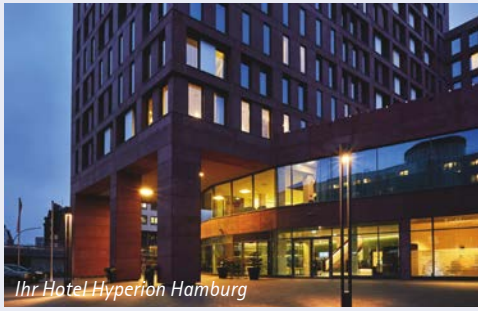
Ihr Hotel Hyperion Hamburg