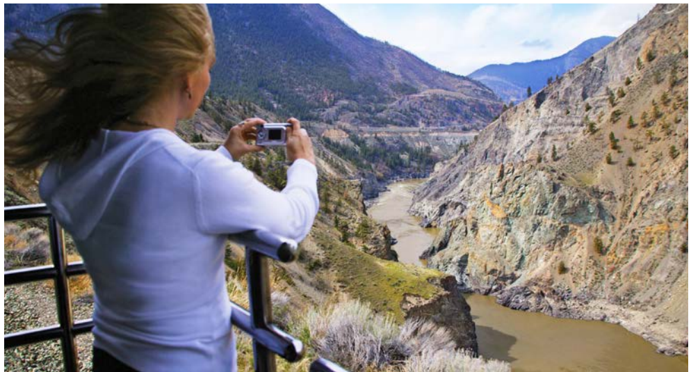
Entlang atemberaubender Landschaften mit dem Rocky Mountaineer

Eine Stadtrundfahrt bringt Ihnen die Metropole am Ontario-See nahe. Einen reizvollen Kontrast zu den das Stadtbild prägenden Wolkenkratzern bilden zahlreiche historische Gebäude. Sie genießen