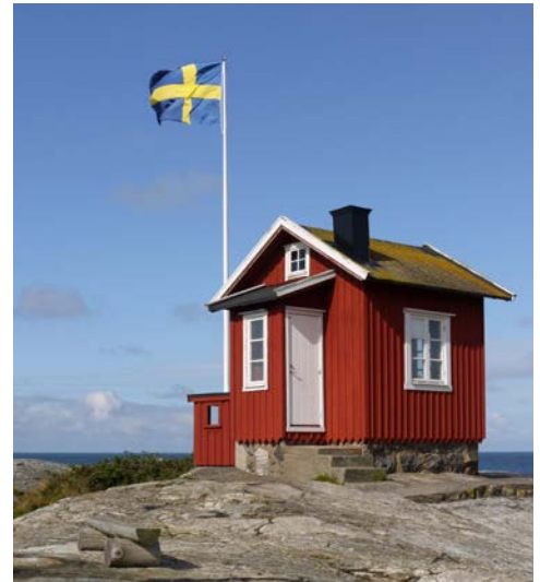
Inselchen im Schärengarten von Göteborg

Die Flussfahrt auf dem Göta Kanal geht weiter. Fröhaufsteher haben die Gelegenheit, zu einem herrlichen Morgenspaziergang von Hajstorp nach Godhøgen, ca. 1,5 km. Alternativ können Sie an Bord bleiben und die Strecke schippern. Die wahrscheinlich kleinste „Hafenstadt“ Schwedens Sjötorp heißt Sie vor der Querung des Vänernsees willkommen. Hier passieren Sie acht Schleusen und ein gut erhaltenes altes Werftgelände. Im Hafemagazin befinden sich ein Laden, der unter anderem Kleider und Einrichtungsgegenstände verkauft, ein Café und auch das Kanal-museum von Sjötorp, welches besucht werden kann. Hier finden Sie historische Bilder von Sjötorp, können die Innenausstattungen alter Kanalschiffe bewundern und etwas über die spannende Geschichte des Göta Kanals lernen. Sie befahren den 44 m hoch gelegenen