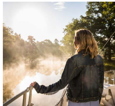
Zauberhafte Stimmungsbilder erwarten Sie