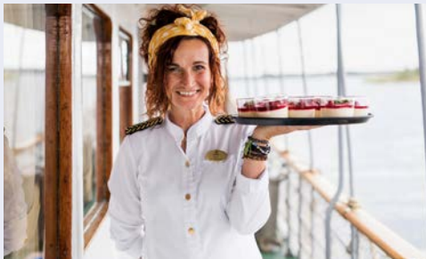
Willkommen an Bord

Sie lieben die Natur, die frische Luft und haben einen Sinn für die charmante Niedlichkeit? Dann sind Sie auf dieser Reise genau richtig. Ihr Ziel: Zwei geschichtsträchtige Großstädte und der berühmte Göta Kanal, eine der originellsten Wasserstraßen der Welt. Gleich zu Beginn verbringen Sie zwei Tage im königlichen Stockholm. In Norsholm gehen Sie an Bord des denkmalgeschützten Passagierschiffs WILHELM THAM. Auf diesem gleiten Sie auf den schönsten Abschnitten des Göta Kanals über die natürlichen Seen Vänern und Vättern, durch unzählige Schleusen und sogar unter zwei Aquädukten hindurch. Zwei Nächte im charmanten Göteborg, sind krönender Abschluss dieser Reise.