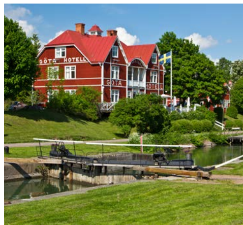
Das historische Göta Hotel direkt am Kanal

des gegrabenen Kanals (91,5 m über dem Meer) ist hier mit einem Obelisken markiert. In Töreboda kreuzt der Kanal die Eisenbahnlinie Göteborg–Stockholm. Sehenswert ist hier Lina, die kleinste Fähre Schwedens, die den Göta Kanal übersetzt. Weiter geht es nach Hajstorp hier wurde im Jahr 1822 der Västgöta-Teil des Göta Kanals eingeweiht. Hier liegt ihr Schiff über Nacht.