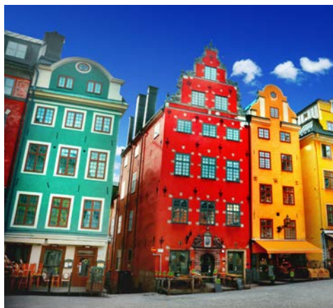
Einladend – die Altstadt Gamla Stan von Stockholm

Tipp: Die Restaurants in Stockholm sind in der Regel sehr gut besucht, wir empfehlen Ihnen, vorab zu reservieren.