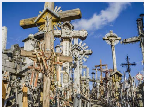
Berg der Kreuze in Litauen