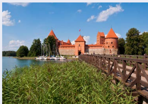
Die Wasserburg von Trakai

im Doppelzimmer € 1.625 im Einzelzimmer € 1.975