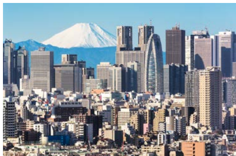
Die Skyline von Tokyo mit dem Fuji im Hintergrund

Erleben Sie die Hauptstadt Tokyo. Auftakt ist der Meiji-Schrein. Die in einen weitläufigen Park eingebettete Gedenkstätte erinnert an Kaiser Meiji und symbolisiert die starke Verbindung des Kaiserhauses mit dem Shintoismus, der alten Naturreligion Japans. Im Stadtteil Shinjuku bewundern Sie das höchste Rathaus der Welt, ein Entwurf des Stararchitekten Kenzo Tange. Von der Aussichtsetage auf über 200 m Höhe bietet sich ein großartiger Panoramablick. Bei einem Bummel durch das vornehme Stadtviertel Ginza genießen Sie im Anschluss das modische Flair