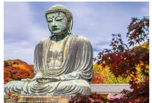
Der Große Buddha von Kamakura