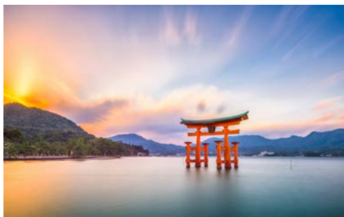
Itsukushima-Schreins während der Flut

Hiroshima nach Himeji, wo sich auf sechs Stockwerken die „Burg des weißen Reihers“ (UNESCO-Weltkulturerbe) eindrucksvoll auftürmt. Die typisch geschwungenen Dächer und die strahlend weiße Fassade geben der Burg Ihren Beinamen. Nachmittags geht es dann per Bus Richtung Japanische Alpen. Ca. 5 Stunden Busfahrt bis Takayama und Check-In in Ihrem Hotel für eine Nacht. Ca. 620 km (F)