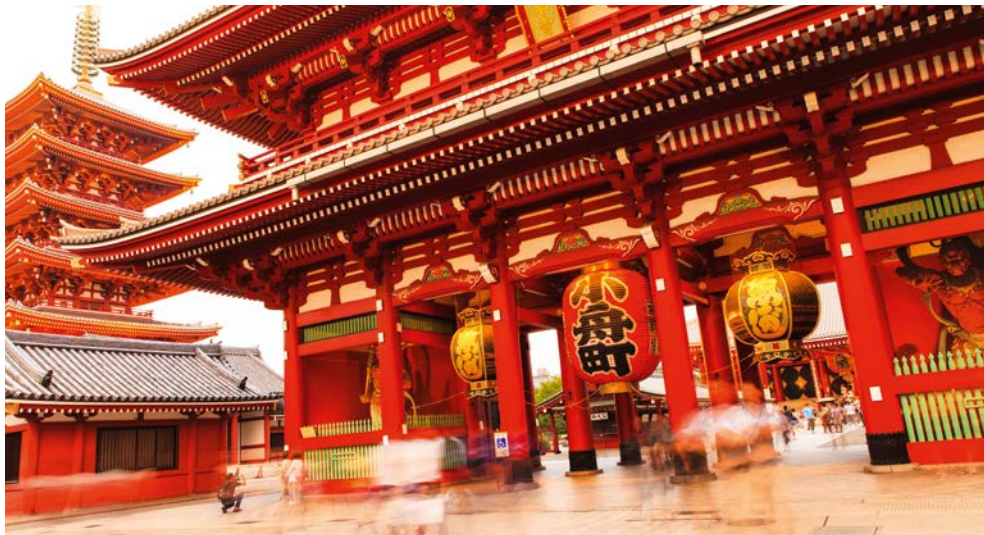
Eingang zum Asakusa-Viertel in Tokio