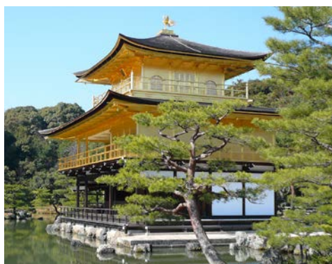
Der Goldene Pavillon

Die ehemalige Kaiserstadt zählt mit ihrer Fülle an Kulturgütern zu den interessantesten Städten Ostasiens. Eine wechselvolle Geschichte hat der Stadt ihr einzigartiges kulturelles Erbe hinterlassen. Bei Buchung des Ausfluges entdecken Sie per Reisebus die schönsten Tempel, Zen-Gärten und Shinto-Schreine. Dazu zählen der Ryoanji-Tempel mit seinem berühmten Zen-Garten, die reizvolle Anlage des Goldenen Pavillons (Kinkakuji) und die Nijo-Residenz des Tokugawa-Shogunats, in der Sie sich in das Palastleben jener Zeit zurückversetzt fühlen. Nachmittags geht es per Reisebus zum Fushimi-Inari-Schrein, dessen schier endlose Schreintor-Galerien zu einem Spaziergang einladen. Zum Abschluss des Tages locken die zahlreichen Geschäfte und Kaufhäuser im pulsierenden Viertel Shijo-Kawaramachi zu einem Shopping-Bummel. Möglichkeit zum Besuch der traditionellen Kyotoer Marktstraße Nishiki-dori. Nirgendwo sonst lässt sich die schier unendliche Vielfalt der berühmten japanischen Küche so hautnah und eindrucksvoll erkunden. (F)