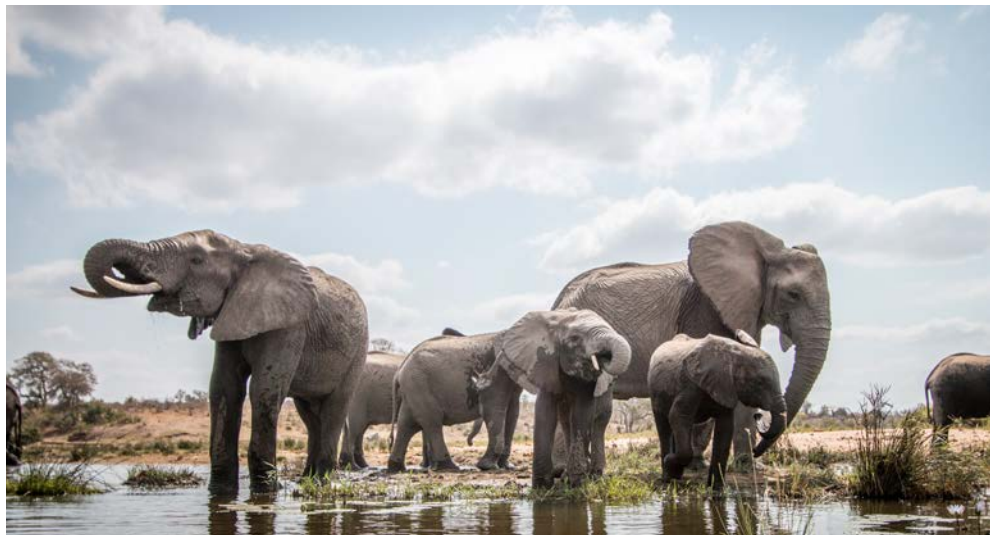
Auf Safari im Kruger Nationalpark

von Grasland geprägte Highveld, das bis zu 3.000 m hohe südafrikanische Hochland. (F/M/A)