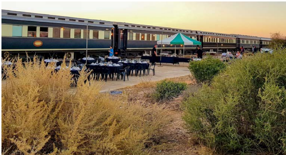
Unterwegs mit dem African Explorer