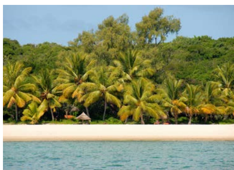
Maputo – Strand am Indischen Ozean

Über Nacht hat Ihr Zug den Bahnhof von Maputo erreicht, der schon im Jahr 1910 eröffnet wurde und als der schönste in ganz Afrika gilt. Nach einer viel zitierten Legende wurde er von Gustave Eiffel gebaut. Sie erkunden die mosambikanische Hauptstadt bei