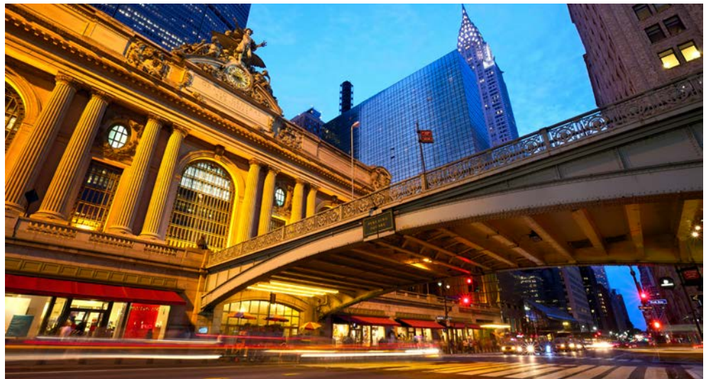
Grand Central, 42nd Street