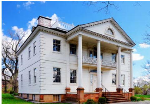
Harlem, Morris Jumel Mansion,

Manhattan hat viele Gesichter: Das Bauwerk Morris Jumel Mansion, das während der Amerikanischen Revolution eine wichtige Rolle spielte, das wohlhabende Viertel Sugar Hill mit seinen imposanten weißen Stadthäusern sowie das Apollo Theater, eine der frühen Karrierestationen Michael Jacksons, wo der spätere King of Pop gemeinsam mit seinen Brüdern in der Band Jackson Five spielte, sind nur einige der vielen versteckten New Yorker Sehenswürdigkeiten. Im Rahmen der Tour besuchen Sie einen Gottesdienst einer Baptistischen Kirchengemeinde, neben Wortbeiträgen natürlich auch mit Gospelgesang. Es handelt sich nicht um eine Aufführung oder Touristenattraktion. Dauer ca. 4 Stunden.