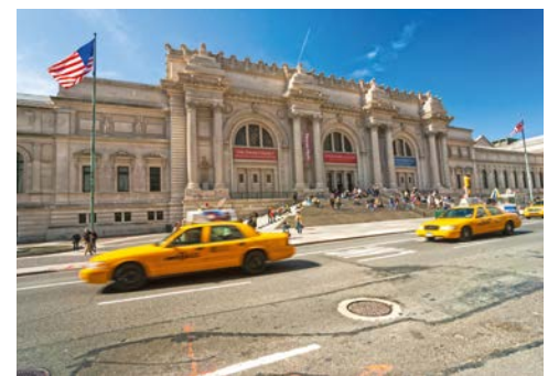
Metropolitan Museum of Art

Kunstsammlungen weltweit gezeigt. Werke weltberühmter Künstler wie Claude Monet, Pablo Picasso und Jackson Pollock sind im MoMA ausgestellt. Darüber hinaus ist das von dem japanischen Star-Architekten Yoshio Taniguchi entworfene Museumsgebäude selbst bereits ein Kunstwerk. Im Anschluss an die Führung bleibt selbstverständlich noch genügend Zeit, um die gewonnenen Eindrücke individuell zu vertiefen. Dauer ca. 4 Stunden.