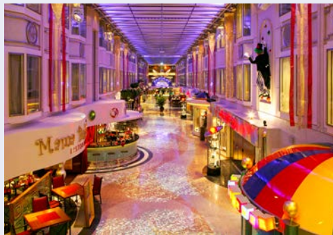
Genießen Sie die Vielfalt an Bord

Übernachten werden Sie übrigens im zentral gelegenen Clarion Hotel® The Hub – idealer Ausgangspunkt für Erkundungen in der Metropole!