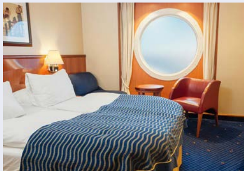
Kabinenbeispiel an Bord