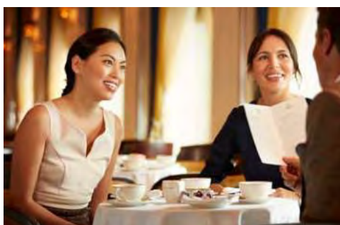
Lassen Sie sich an Bord verwöhnen