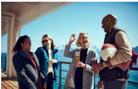
Entspanntes Leben an Bord

Bordwährung: Die Bordwährung ist der US-Dollar. An Bord der QUEEN MARY 2 herrscht bargeldloser Zahlungsverkehr. Alle Ausgaben, die Sie an Bord tätigen, werden Ihrem Bordkonto belastet. Am Ende erhalten Sie eine detaillierte Abrechnung, die Sie bequem per Kreditkarte (gängige Kreditkarten werden akzeptiert) bezahlen.