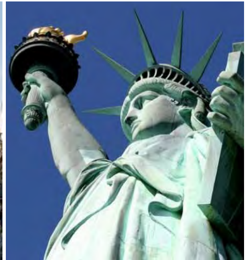
„Ikonen“ Manhattans – das Flat Iron Building und die Freiheitsstatue