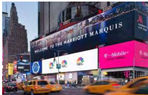
Ihr Hotel liegt „mittendrin“ – direkt am Times Square

Bordsprache: Englisch. Wichtige Informationen, wie Bordnachrichten, Tagesprogramme und Menükarten sind in deutscher Sprache erhältlich. Eine Deutsch sprechende Hostess betreut die deutschen Gäste an Bord.