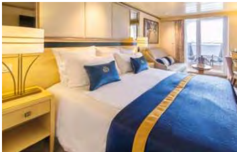
Balkonkabine – Beispiel

Mit der QUEEN MARY 2 erleben Sie Kreuzfahrt nach bester Seefahrertradition – Eleganz im Stil der klassischen Ocean Liner kombiniert mit Komfort, Moderne und Perfektion. Erleben Sie an Bord der QUEEN MARY 2 erholsame Urlaubstage mit vielfältigen sportlichen und kulturellen Unterhaltungsmöglichkeiten sowie erstklassigen Service. Urlaub könnte nicht schöner sein! Freuen Sie sich u.a. auf einen spektakulären Ausblick auf den Sternenhimmel im einzigen Planetarium der Weltmeere, auf ein ausgewähltes Unterhaltungsprogramm wie Konzerte und Shows im Royal Court Theatre oder auf Entspannung im modern eingerichteten Mareel Spa® mit Sauna, Thalasso Pool u.v.m.