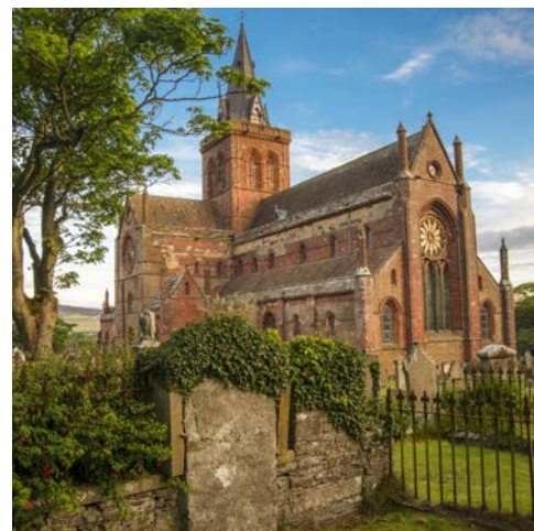
St. Magnus Kathedrale in Kirkwall