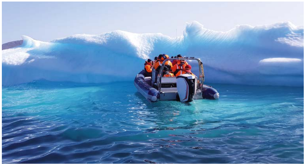
Spannende Zodiac-Ausfahrten warten auf Sie

Alle Routen, Landausflüge und Zodiac-Ausflüge sind vorläufig und abhängig von den Eis-, See- und Wetterbedingungen, die den Reiseverlauf beeinflussen können. Die Ausflüge mit den Zodiacs sind zudem abhängig von behördlichen Genehmigungen. Änderungen des Reiseverlaufs sind daher ausdrücklich vorbehalten.