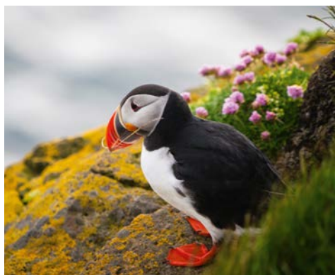
Mit etwas Glück sehen Sie einen Papageientaucher!

Genießen Sie das Bordleben und freuen Sie sich auf die interessanten Vorträge der Lektoren.