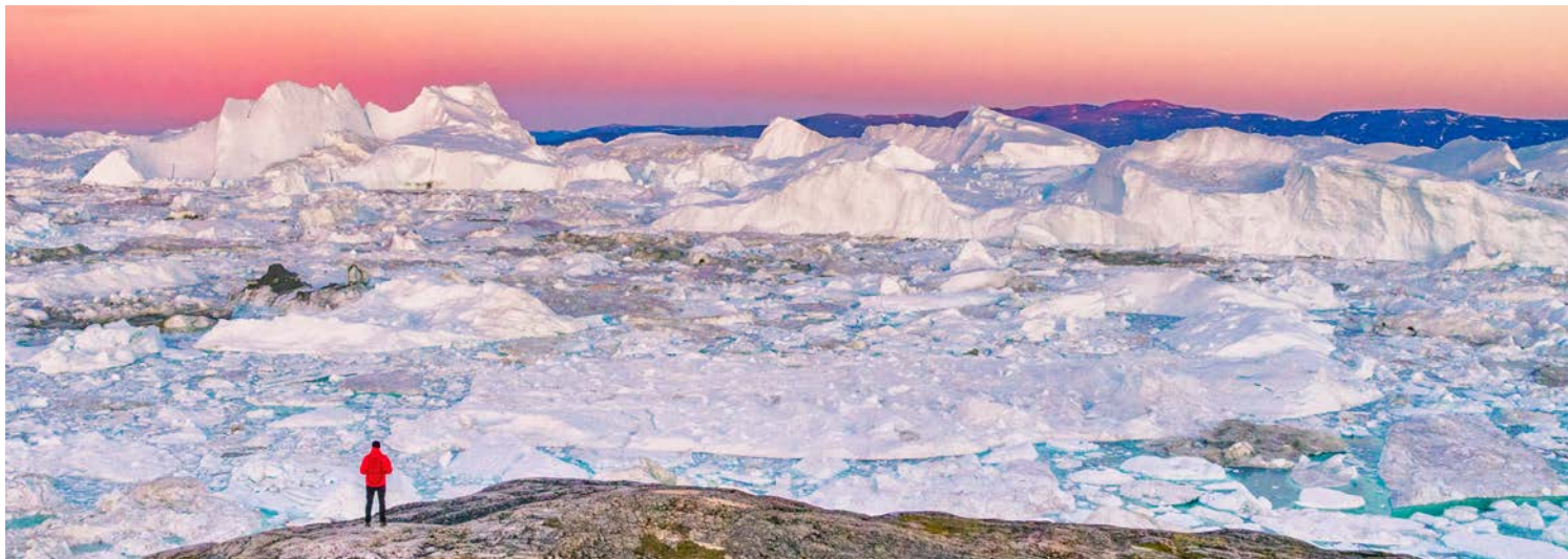
Impressionen in Grönland

Der Sund verbindet die Labradorsee im Westen mit der Irmingersee im Osten. Die Meeresstraße ist etwa 100 Kilometer lang, die Ufer teils über 1000 Meter hoch. Mehrere Gletscher erreichen den Sund, in den auch zahlreiche Wasserfälle münden. Die Fahrt durch den Prinz Christian Sund gehört unbestritten zu den schönsten Schiffspassagen der Welt.