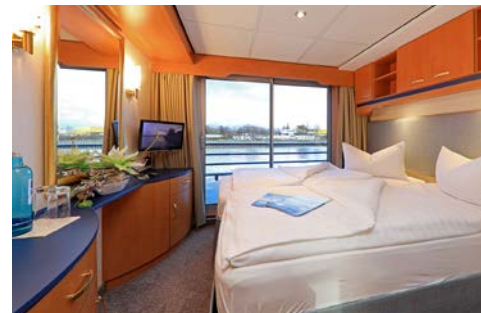
Kabinenbeispiel Elbedeck mit frz. Balkon

Reisedokumente: Deutsche Staatsangehörige benötigen einen gültigen Reisepass oder Personalausweis. Sollten Sie einer anderen Staatsbürgerschaft angehören, weisen Sie uns bitte darauf hin. Wir beraten Sie gern.