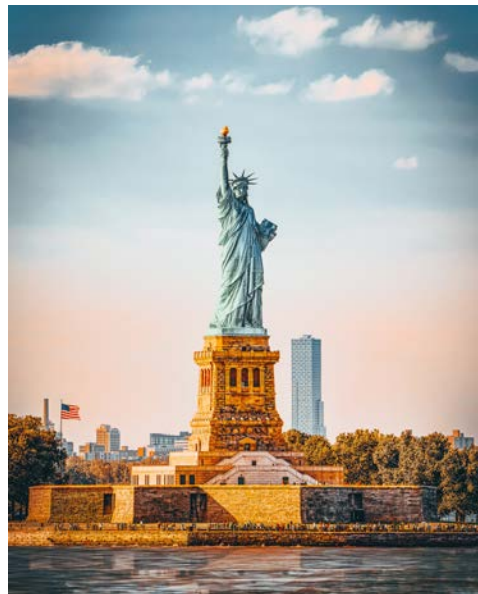
Willkommen in New York!

Willkommen in New York! Nach der Begrüßung am Hafen unternehmen Sie zunächst eine Stadtrundfahrt. Sie kommen vorbei an einigen ausgesuchten Sehenswürdigkeiten, wie dem UN-Hauptquartier, Empire State Building, Central Park und Rockefeller Centre. Sie sehen die Wall Street, das weltbekannte Finanzviertel, den Times Square und den Broadway. Anschließend Transfer zum Flughafen für Ihren Rückflug. Ankunft am 13. Tag in Deutschland.