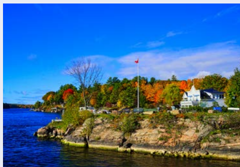
Im Seengebiet der Thousand Islands