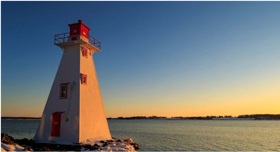
Leuchtturm von Charlottetown auf Prince Edward Island