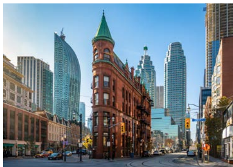
Auch in Toronto gibt es ein Flatiron Building