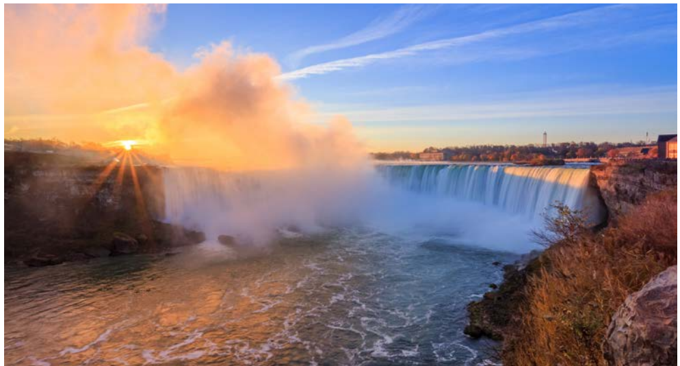
Majestätisch – die Niagara-Fälle