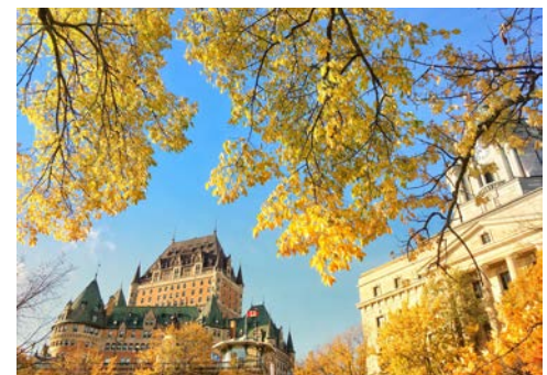
Chateau Frontenac in Québec

Am Morgen spazieren Sie gemeinsam durch die Altstadt, und es bleibt Ihnen anschließend noch ein wenig Zeit zur freien Verfügung. Kurz nach Mittag erfolgt die Einschiffung. Die NORWEGIAN JOY bleibt noch über Nacht in Québec.