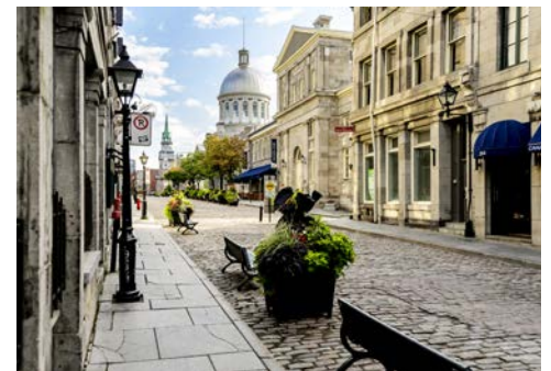
Sie wännen sich in Paris? Nein, das ist Montréal!