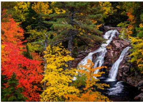
Natur pur auf Cape Breton Island