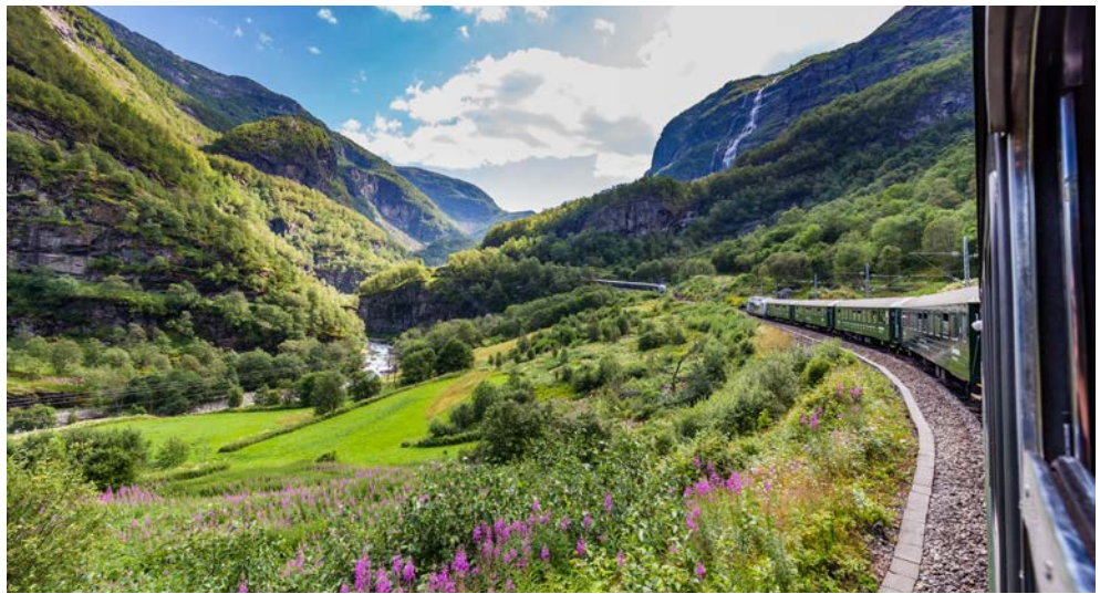
Unterwegs mit der Flåmbahn

Sind Sie bereit für ein Naturschauspiel der Superlative? Begeben Sie sich auf diese einmalige Reise mit der MSC EURIBIA – das neueste MSC-Schiff mit nachhaltiger Technologie. Auftakt Ihrer Kreuzfahrt ist die charmante dänische Metropole Kopenhagen. Dann erwarten Sie die traumhaften Küstenlandschaften Norwegens. Zaubhafte kleine und große Städte liegen malerisch an grandiosen Fjorden. Ebenso vielfältig wie Ihre Entdeckungen an Land ist das Leben an Bord. Auf diesem einzigartigen Schiff treffen Kunst, Genuss und Innovation zusammen. Dabei ist der Name Programm: Die MSC EURIBIA wurde nach der antiken Göttin Eurybia benannt, die Wind, Wetter und Sternkonstellationen nutzte, um die Meere zu beherrschen. Damit unterstreicht MSC Cruises seine Vision, den Einsatz modernster, umweltfreundlicher Technologien zum Schutz und Erhalt der wertvollen marinen Ökosysteme zu fördern.