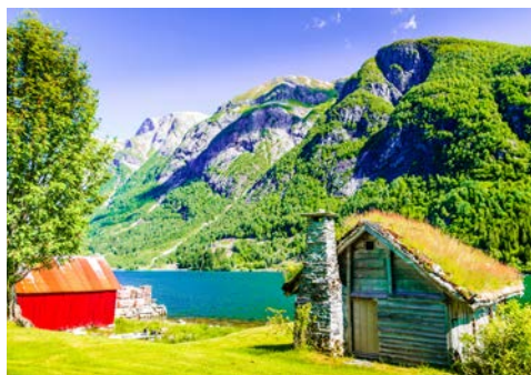
Idylle im Sognefjord

Nach der Ausschiffung am Morgen erfolgt Ihre Rückreise.