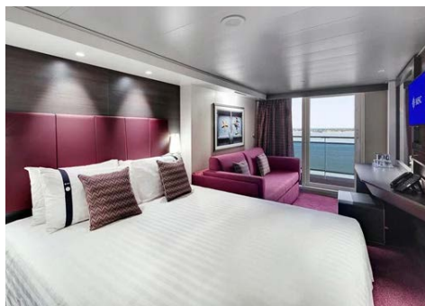
Einladend – die Kabinen an Bord (hier: mit Balkon)