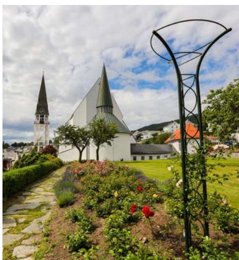
Kathedrale in Molde