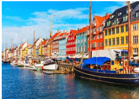
Farbenfrohe Fassaden in Nyhavn, Kopenhagen

Anreise wie gebucht nach Kiel. In der Fördestadt wartet die MSC EURIBIA bereits zur Einschiffung auf Sie.