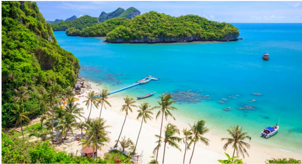
Wunderschönes Ko Samui