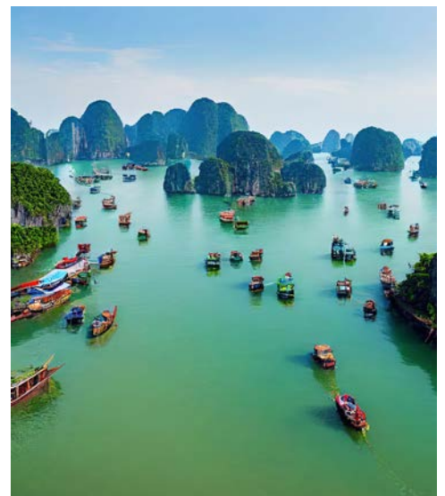
Weltkultur-Erbe – die Halong-Bucht