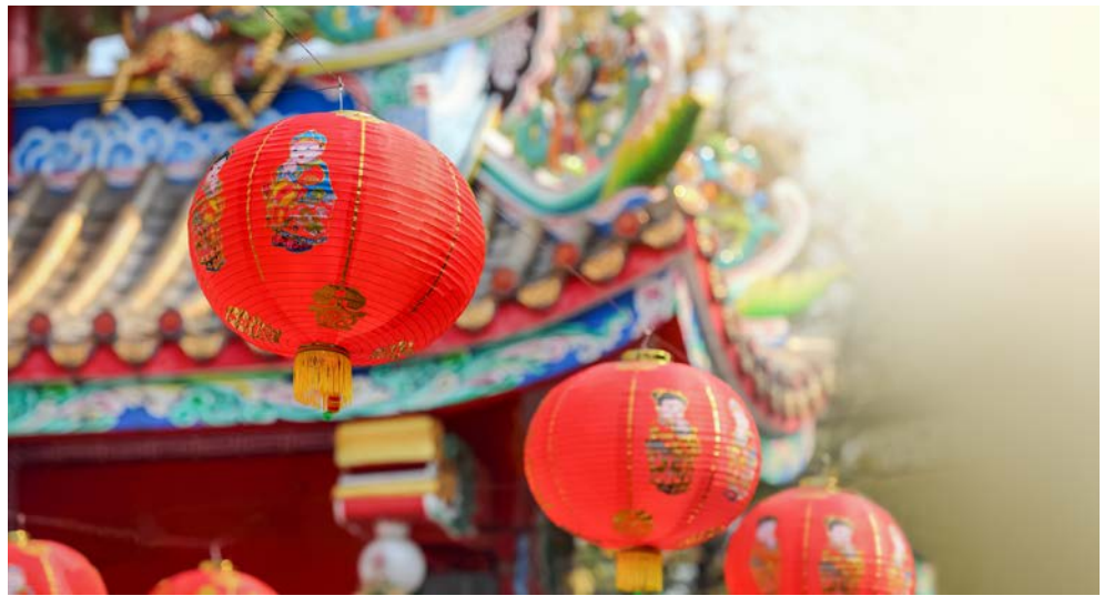
Tauschen Sie ein in die Geschichte und Kultur von Singapur