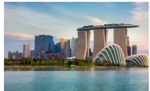
Blick auf die Marina Bay