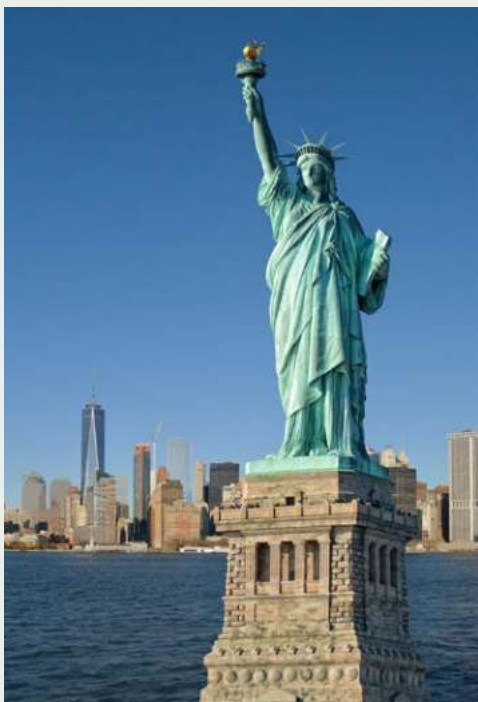
Freiheitsstatue vor Manhattan

Die älteste Stadt Kanadas besticht durch ihre Freundlichkeit – und überwältigende Aussichten! Unternehmen Sie eine Kajakfahrt, beobachten Sie Wale oder schlendern Sie durch die George Street mit ihren zahlreichen Bars und Restaurants. Auch die Preiselbeer-Muffins (eine Spezialität Neufundlands) und die nationalhistorische Stätte Cape Spear sollten Sie sich nicht entgehen lassen.