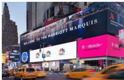
Das New York Marriott Marquis liegt „mittendrin“

Erleben Sie die lebendige Atmosphäre Manhattans im neu renovierten New York Marriott Marquis direkt am Times Square. Das Haus bietet eine perfekte Anbindung zu den Sehenswürdigkeiten der Stadt. Gönnen Sie sich herzhaftes New Yorker Gerichte dank der innovativen Speisekarte in den neu gestalteten Restaurants, zu denen auch der einzige rotierende Speiseraum der Stadt mit Rundumblick auf Manhattan zählt. Entspannen Sie sich in den geräumigen Zimmern, die mit modernen Annehmlichkeiten und einem atemberaubenden Blick auf den Broadway und den Times Square begeistern.