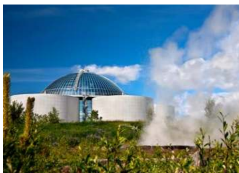
Futuristisch – das Perlan Museum in Reykjavik

Island gilt nicht umsonst als das Traumziel eines jeden Fotografen. Die fantastische Landschaft hält Ausblicke auf Lavaströme, heiße Quellen und unberührte Natur bereit. Inmitten dieser unglaublichen Umgebung liegt Reykjavik, die nördlichste Hauptstadt Europas. Nach der Ausschiffung unternehmen Sie eine Stadtrundfahrt, die Ihnen die wichtigsten Sehenswürdigkeiten der Stadt nahe bringt. Dabei besuchen Sie auch die Aussichtsplattform auf dem Reykjavik Perlan Museum. Schon das Gebäude selbst ist unglaublich – ein futuristisches Meisterwerk. Von oben genießen Sie einen spektakulären 360-Grad-Blick auf Reykjavik, die Halbinsel Reykjanes und den Snæfellsjökull-Gletscher. Danach laden wir Sie zum Mittagessen im beliebten Brauhaus Bryggjans