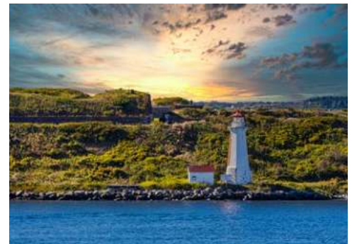
Georges Island Lighthouse in der Bucht von Halifax

Es gibt so viele Bars und Lounges an Bord, dass es ein paar Tage dauern kann, bis Sie Ihren Favoriten gefunden haben. Ganz gleich, ob Sie sich mit Freunden