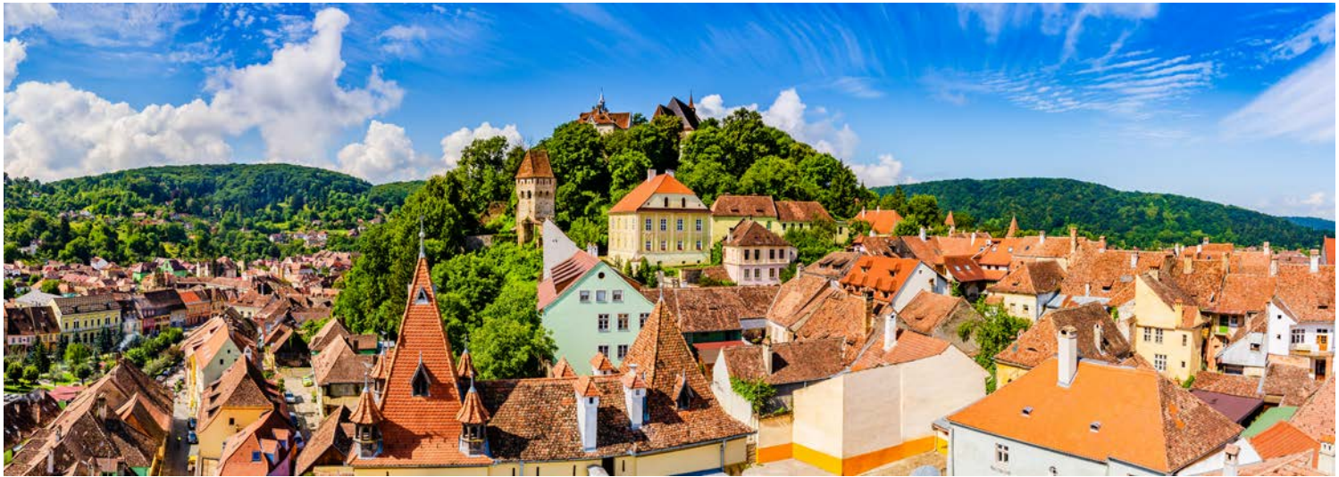
Sighisoara – eine der am besten erhaltenen mittelalterlichen Städte Europas