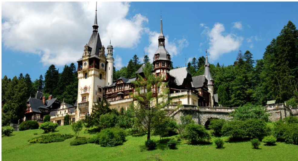
Das Schloss Peles in Sinaia

seinen Sieg in der Schlacht von Vaslui erbaut. Kloster Agapia schließlich zählt zu den größten Nonnenklöstern Europas, auf dessen Klostergelände sich Werke des berühmten rumänischen Malers Nicolae Grigorescu befinden. Im 600 Jahre alten Örtchen Vama besuchen Sie das beeindruckende Ostereier-Museum mit seiner Sammlung aus über 3.000 handbearbeiteten Eiern aus der ganzen Welt. Bei einer Vorführung werden Sie in die meisterhafte Handwerkskunst eingeführt.