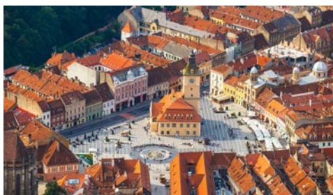
Die Altstadt von Brasov

Der Name kam zustande, als von der Marienkirche nach einem Stadtbrand im 17. Jh. nur noch die rauchgeschwärzten Mauern übrig waren – nach sorgfältiger Restauration zeigt sich die Schwarze Kirche heute in hellem Steinton. Anschließend erwartet Sie eine kleine Sektkostprobe in der königlichen Kellerei Azuga. Am Nachmittag besuchen Sie in Sinaia eines der modernsten Schlösser im 19. Jh., das Schloss Peles, die Sommerresidenz der königlichen Familie der Hohenzollern. Weiterfahrt in die Hauptstadt Rumäniens und Abendessen in einem Restaurant in der Stadt.