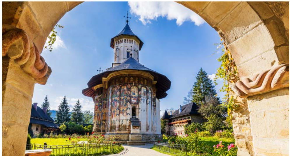
Das Kloster Moldovita