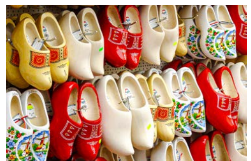
Erfahren Sie mehr über holländischen Käse und Holzschuhe