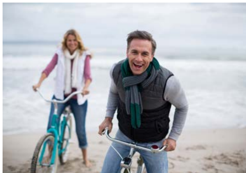
Per Rad macht es einfach mehr Spaß