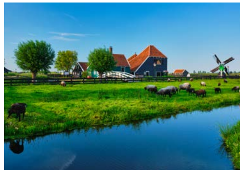
Zaanse Schans – Ein Besuch ist lohnenswert