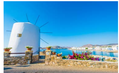
Beliebter Treffpunkt auf Paros – die Windmühle am Hafen

Ihre Reise beginnt mit dem Flug nach Santorin. Die einzigartige vulkanische Landschaft der griechischen Insel Santorin ist ein ganz besonderes Ziel. Schwarzrote Strände und kleine, verschlafene Orte, die sich in 300 m Höhe an einen Fels hang schmiegen, prägen das Bild der Insel. Am Flughafen werden Sie von Ihrer örtlichen, Deutsch sprechenden Reiseleitung empfangen und zu Ihrem Hotel begleitet. Abendessen in einer Taverne. (A)