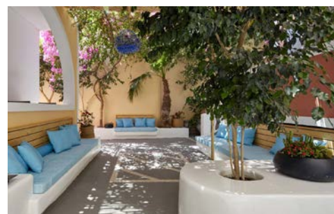
Innenhof Ihres Blue Sea Hotels

In einem ruhigen Viertel von Parikia, jeweils einen 10-minütigen Spaziergang von der Stadtmitte und vom Hafen von Paros entfernt, begrüßt Sie das Eri Hotel. Es bietet Ihnen einen großen Swimmingpool, 2 Bars und Zimmer mit kostenfreiem WLAN. Sie wohnen inmitten eines schönen Gartens. Die Zimmer sind traditionell eingerichtet und verfügen über einen Balkon. Klimaanlage, Sat-TV und ein Mini-Külschrank zählen zur Ausstattung. Ein 24-Stunden-Zimmerservice ist ebenfalls verfügbar.