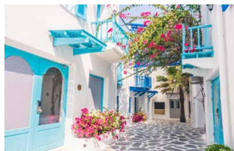
Zauberhafte Gassen auf Santorin