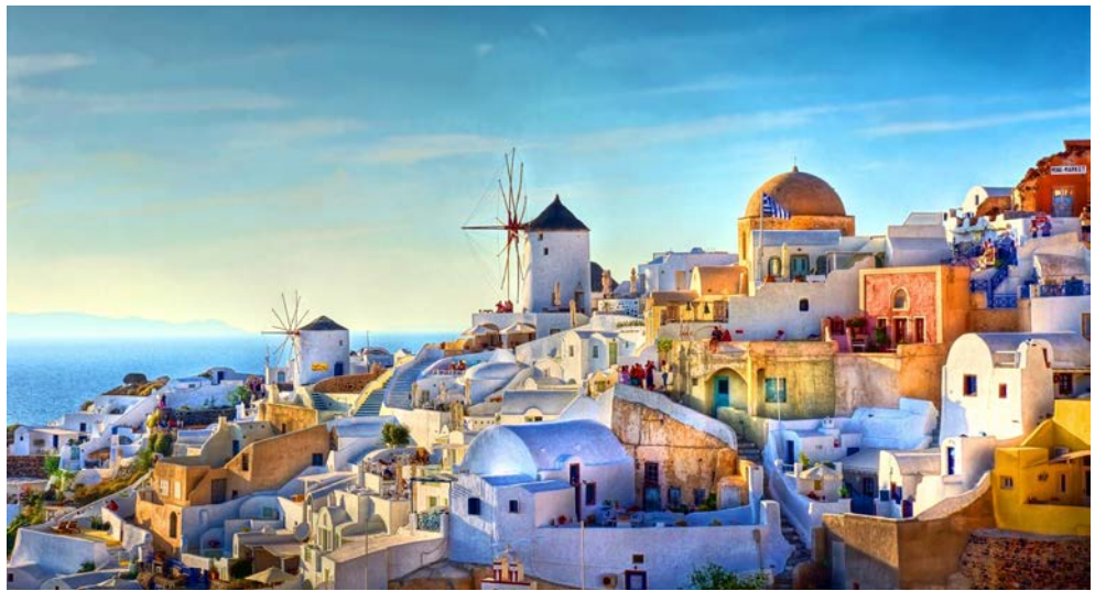
Tolle Aussichten auf Santorin

Wahrhaft göttlich ist die Schönheit der Kykladeninseln. Bunte Fischerboote wiegen sich im Wind, weiß getünchte Häuschen mit hellblauen Türen und Fensterläden leuchten Ihnen entgegen. Die Kykladen gelten als der griechische Garten Eden der Ägäis. Die Stationen Ihrer Reise sind die Vulkaninsel Santorin, die berühmteste und vielleicht auch schönste der Kykladen-Inseln, Naxos, die größte Insel der Kykladen. Naxos Stadt begeistert mit einer zaubernden Altstadt, die seit dem Mittelalter kaum verändert wurde. Paros, die Insel im Herzen der Kykladen, mit ihren Stränden und dem kristallklaren Wasser, den traditionellen Dörfern und der atemberaubenden Landschaft eine unvergleichliche, natürliche Schönheit und last but not least Mykonos, die kosmopolitische, bezaubernde Insel der Kykladen. Jeden Tag erleben Sie einen neuen Höhepunkt, wobei trotz der vielen Besichtigungsmöglichkeiten am Ende der Reise auch Zeit zum Entspannen und zum Baden im Pool bleiben.