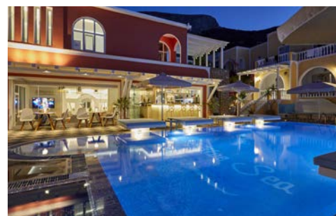
Pool Ihres Blue Sea Hotels