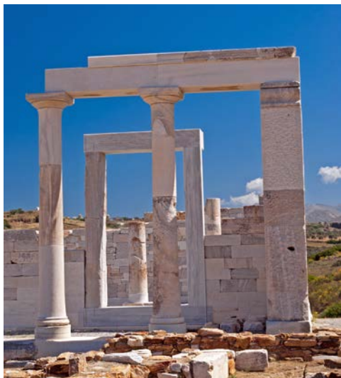
Tempel der Demeter auf Delos

verschiedener Likörsorten nicht fehlen. Sie fahren weiter zum typischen Kykladendorf Apeiranthos. Rückfahrt nach Paros und Abendessen in einer Taverne. (F,A)