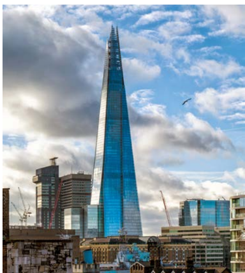
Beeindruckend – The Shard

Bevor es heute „Goodbye London“ heißt, steht ein Besuch in der großartigen Tate of Modern Art auf dem Programm. Untergebracht in einem umgebauten Kraftwerk zählt sie zu den weltweit größten Museen für moderne und zeitgenössische Kunst. Anschließend erleben Sie selber auf einem Spaziergang über die Millennium-Bridge die Schwingungen der einzigartigen Fußgänger-Hängebrücke. Danach erfolgen der Transfer zum Flughafen und der Rückflug von London.