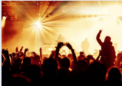
Freuen Sie sich auf ein sensationelles Konzert-Event