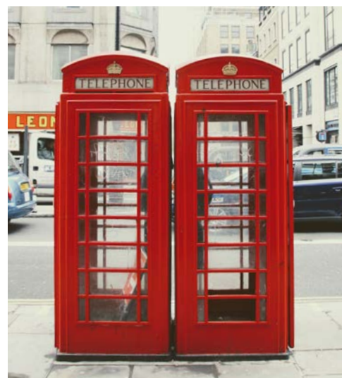
Typisch Londoner Telefonzellen