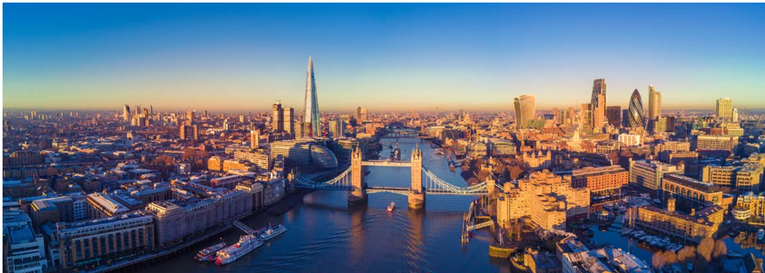
London zwischen Tradition und Hyper-Moderne