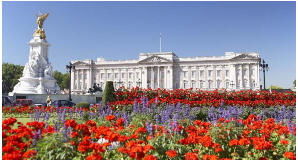
Blick auf den Buckingham Palace

Dancing Queen – Mamma Mia – Money, Money, Money und The winner takes it all – Songs der legendären weltweit populärsten schwedischen Popband aller Zeiten. Seien Sie mit dabei, wenn in der einzigartigen ABBA-Arena in London Agnetha Björn, Benny, Anni-Frid als Avatare Sie auf einem nie zuvor gesehenen Konzert, wieder in die 70er und 90er Jahre eintauchen lassen, bei dem physische und digitale Grenzen verschwimmen. Tauchen Sie ein in die Weltmetropole London, Europas größter Hauptstadt mit großartiger und gegensätzlicher Architektur. Besuchen Sie die Tate of Modern Art, untergebracht in einem umgebauten Kraftwerk, zählt sie zu den weltweit größten Museen für moderne und zeitgenössische Kunst. Besichtigen Sie die Krönungskirche der englischen Monarchen Westminster Abbey und bestaunen Sie die Juwelen ihrer Majestät im Tower of London. Erleben Sie London aus der Vogelperspektive und werfen Sie einen Blick hinter die Kulissen der weltberühmten Sommerresidenz Schloss Windsor. Bummeln Sie durch das bekannte Kaufhaus Harrolds und genießen Sie die traditionelle englische Teatime.