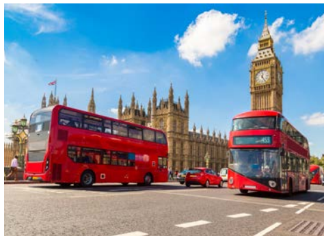
Big Ben, Doppeldecker und Houses of Parliament