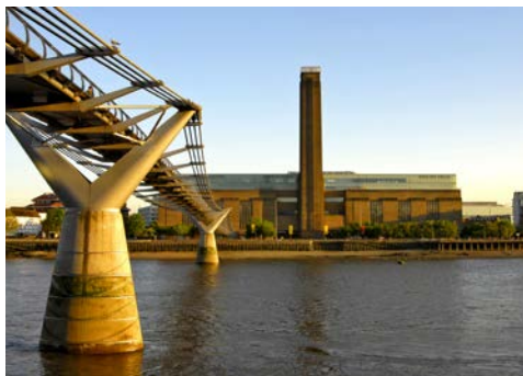
Die „Tate Modern“ an der Themse

of Parliament zum berühmtesten und historisch bedeutendsten Bauwerk Englands, The Westminster Abbey, gelangen. Auf einem geführten Rundgang besichtigen Sie die Krönungskirche der englischen Monarchen und Begräbnisstätte gekrönter Häupter, wie Mary Stuart, sowie berühmter Briten, wie den Wissenschaftler Isaac Newton oder Charles Darwin. 1056 durch Edward The Confessor im normanischen Stil errichtet, erhielt sie 1245 durch Henry III. ihr heutiges Erscheinungsbild im Stil der französischen Gotik. Am Abend besuchen Sie The Shard den höchsten Wolkenkratzer Europas. Sie fahren auf Level 31 und genießen Ihr Abschiedsabendessen mit Aussicht auf die beleuchtete Stadt aus der Vogelperspektive.