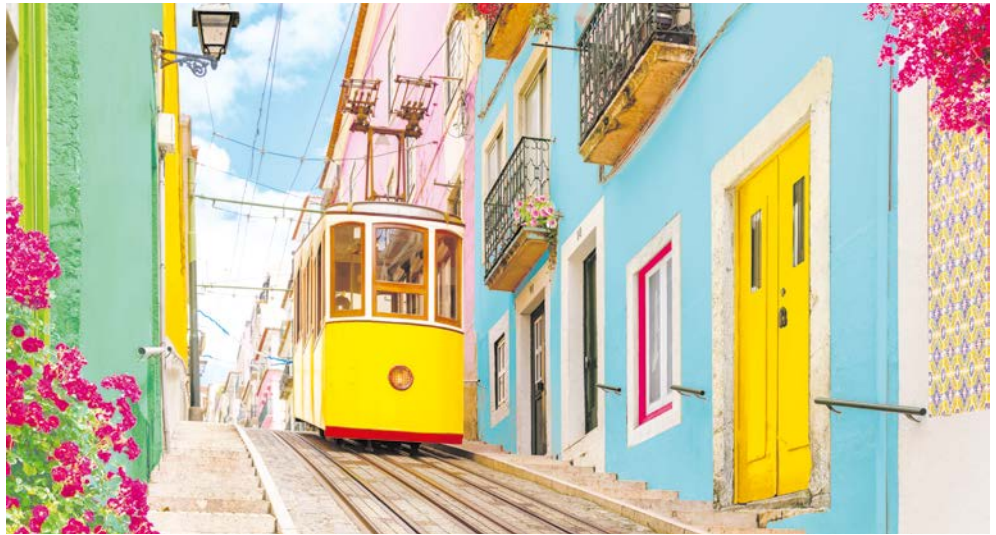
Mit der Straßenbahn in Lissabon – ein Erlebnis!

Genießen Sie bei Ihrem Vorprogramm in Lissabon Ihre ersten Urlaubstage und entdecken Sie die faszinierende Metropole, bevor Sie sich mit der beliebten VASCO DA GAMA auf eine abwechslungsreiche Kreuzfahrt durch das malerische Mittelmeer begeben. Tauchen Sie in Cádiz in die spanische Lebensweise ein. Schlendern Sie in Motril durch das historische Stadtzentrum oder erkunden das reiche kulturelle Erbe Andalusiens bei einem Ausflug zur Alhambra. Wunderschöne Sandstrände und historische Stätten erwarten Sie auf Sardinien und in Palermo lockt neben der reichen Geschichte und der beeindruckenden Natur auch der Straßenmarkt Ballaró. Den krönenden Abschluss dieser Traumkreuzfahrt bildet schließlich ein möglicher Besuch im antiken Olympia.