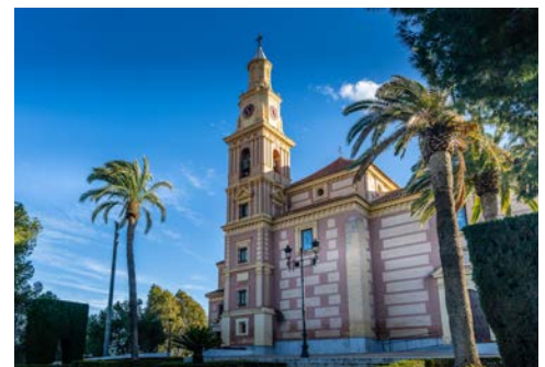
Kirche La Encarnación in Motril