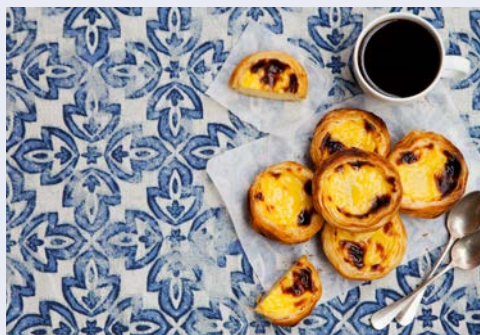
Die leckeren Pastéis de Nata

Cádiz gehört zu den ältesten Städten Westeuropas und zeichnet sich durch eine verwinkelte Altstadt mit vielen kleinen Plätzen aus. Cádiz blickt auf mehr als 3.000 Jahre Geschichte zurück – der Legende zufolge soll sie von Herkules gegründet worden sein. In Frühzeiten nutzten schon Phönizier und Römer das alte Gadir als Umschlagplatz; heute noch spielen Handel und Hafen eine wichtige Rolle. Der ältere und interessantere Teil von Cádiz breitet sich über das Ende einer Landzunge aus, die von historischen Bollwerken und freundlichen Promenaden besetzt ist. Die mehr als 100 Wachtürme, darunter der berühmte Torre Tavira, dienten traditionell dazu, nach Schiffen Ausschau zu halten