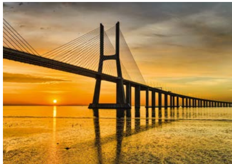
Die Vasco da Gama Brücke

↕ Schiff liegt auf Reede, Ausbooten wetterabhängig.