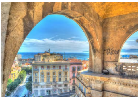
Cagliari auf Sardinien

Idyllisch zu Füßen der Sierra de Lújar gelegen, erfreut Motril seine Besucher mit mildem subtropischem Klima – deshalb nennt man diesen Küstenabschnitt auch „Costa Tropical“. Schlendern Sie durch die Altstadt, entdecken Sie Überbleibsel der reichen Geschichte, denn hier siedelten schon Phönizier und Römer. Oder Sie nutzen die Gelegenheit, um von hier aus einen Ausflug Richtung Granada und seiner berühmten Alhambra zu unternehmen.