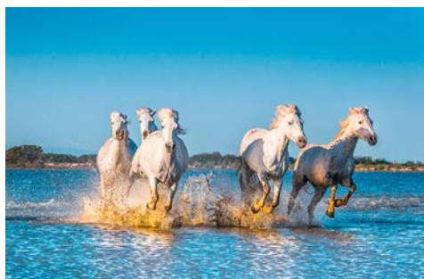
Die Pferde der Camargue