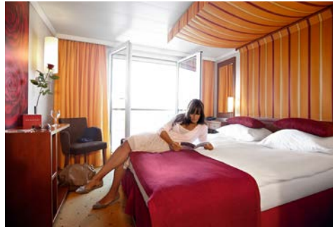
Kabinenbeispiel Kat. C/D

Ziehen Sie ein paar Bahnen im Pool oder entspannen Sie direkt daneben – das Sonnendeck lädt zum Abschalten ein, während die A-ROSA STELLA an bezaubernden Landschaften oder malerischen Städten vorbeizieht. Jeden Tag erleben Sie einen anderen einzigartigen Landstrich Südfrankreichs. Kultur, Shopping und Kulinarik werden hier ebenso großgeschrieben wie Wellness. Im bordeigenen SPA-ROSA träumen Sie bei wohlthuenden Massagen schon von den kulinarischen Highlights, die Sie im Restaurant erwarten. Ihre komfortable Kabine rundet diese einzigartigen Momente ab und bietet die Möglichkeit, die schönsten Erlebnisse des Tages bei einem schmackhaften Glas Wein Revue passieren zu lassen.