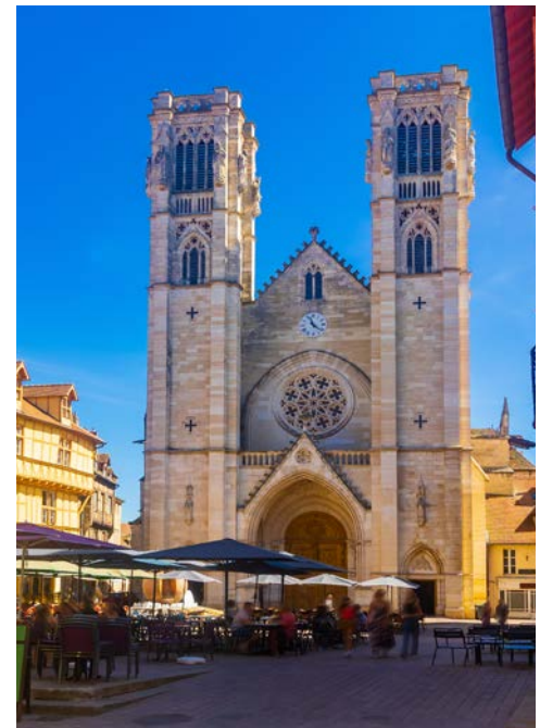
Cathédrale St. Vincent in Chalon-sur-Saône

In Chalon-sur-Saône, der Stadt von Niépce, dem Erfinder der Fotografie, sollten Sie dem Rundweg „Chemin de l'Orbandale“ folgen. So kommen Sie an wunderschönen Fachwerkhäusern, dem quirligen Place Saint-Vincent im Zentrum, an der Kathedrale mit ihrem beeindruckenden Kloster, am Glockenturm und an der Île Saint-Laurent vorbei.