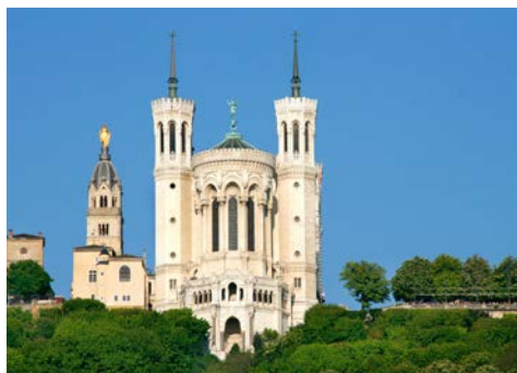
Basilika von Lyon

Mâcon ist die südlichste Stadt im Burgund und Mittelpunkt des Mâconnais. Der freundliche, schon fast südländische, Charakter wird von einem wahren Blumenmeer in der Stadt unterstrichen. Unternehmen Sie einen Spaziergang auf den Spuren des Dichters Lamartine oder entspannen Sie bei einem Glas Wein an der Uferpromenade. Hier kommen Sie auf den Genuss!