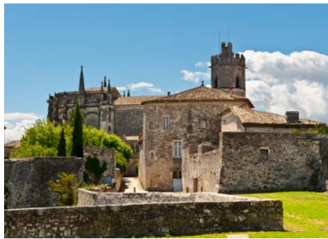
Viviers – auf den Spuren des Mittelalters

Ein Juwel – diese mittelalterliche Stadt müssen Sie gesehen haben. Hier gibt es die kleinste Kathedrale Frankreichs, und anders als in den touristisch entwickelten Perlen am linken Rhôneufer, scheint Viviers noch wie im Dornröschenschlaf versunken. Ein