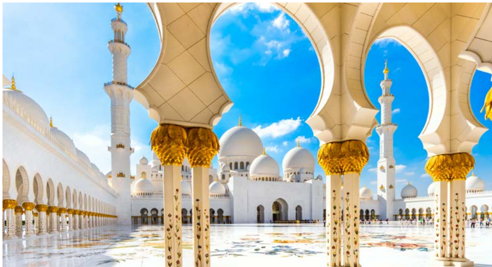
Abu Dhabi – Sheikh Zayed Moschee