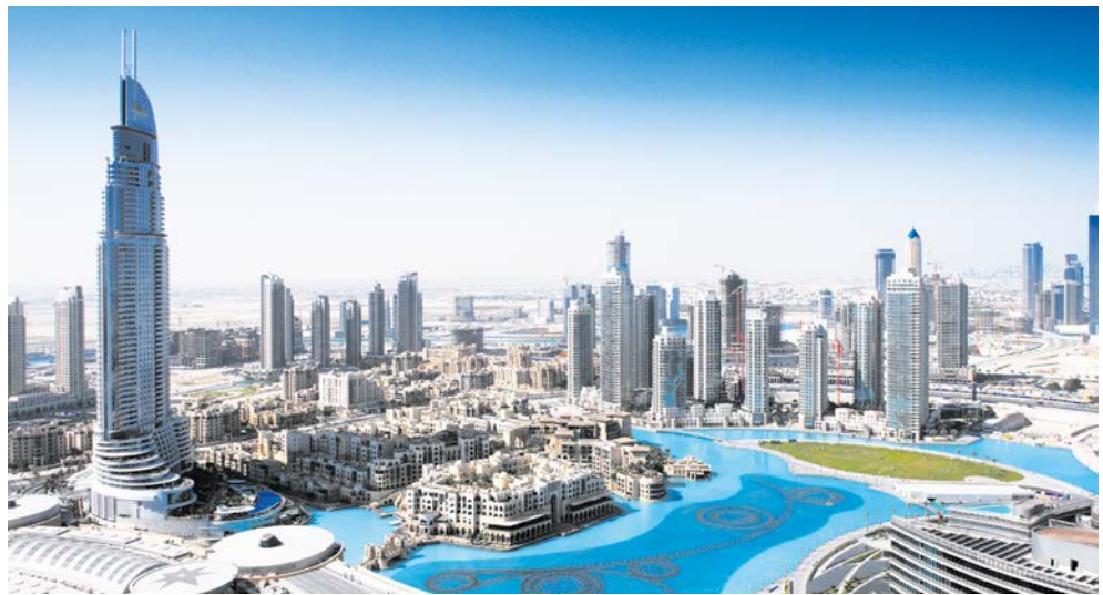
Die Skyline von Dubai