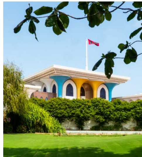
Der Sultanspalast in Maskat

dem Burj Khalifa-Tower. Von der Aussichtsplattform in der 124. Etage auf 404 m genießen Sie, wenn Sie mögen, einen grandiosen Ausblick auf die Stadt, die Wüste und das Meer (nicht im Ausflugspreis enthalten). Rückfahrt zum Hotel.