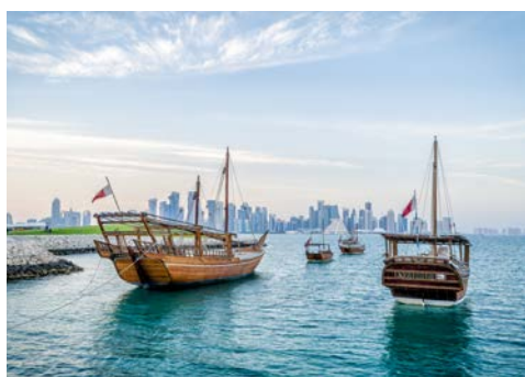
Stilechte Dhows vor der Skyline in Doha

Genießen Sie den heutigen Tag an Bord und lassen Sie sich verwöhnen.