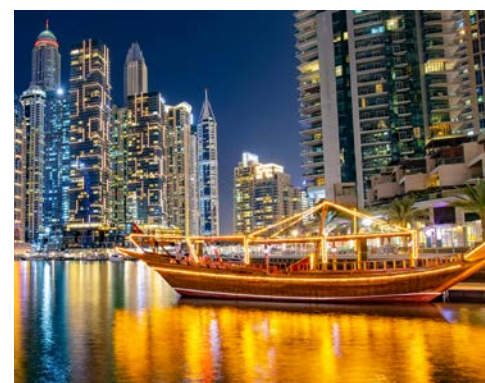
Freuen Sie sich auf die Dhow Cruise