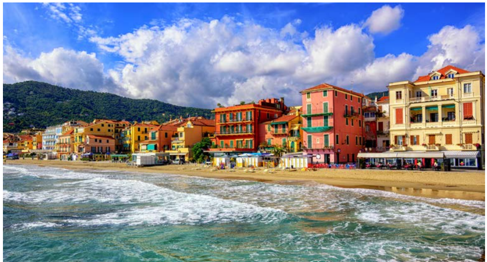
Ihr bezaubernder Urlaubsort Alassio