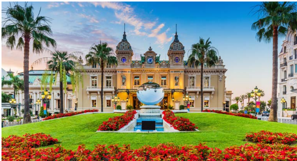
Das berühmte Kasino von Monte Carlo