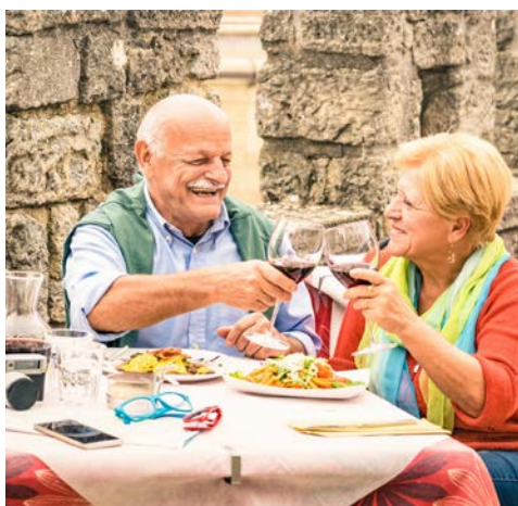
Die ligurische Küche ist ein Genuss