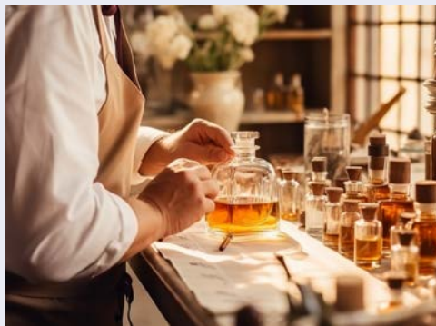
Die Welt des Parfums

Weitere buchbare Ausflüge führen Sie in das einmalige Genua oder nach San Remo, durch Weinanbaugebiete und in pittoreske Bergdörfer. Genießen Sie die herrliche Landschaft der italienischen und französischen Riviera und lassen Sie sich von Kunst, Kultur und Lebensstil der Mittelmeerregion verzaubern.