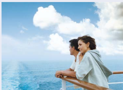
Immer eine gute Aussicht an Bord

Einzelkabinen/-kabine ab € 7.499,- auf Anfrage. Sie erhalten Ihre Kabinennummer mit den Reiseunterlagen. *Sichtbehinderung. Zzgl. Visum für Australien (ca. 20,- AUD), für Neuseeland NZeTA (ca. 17,- NZD) sowie Tourismussteuer in Höhe von 35,- NZD (Beantragung und Zahlung vorab).