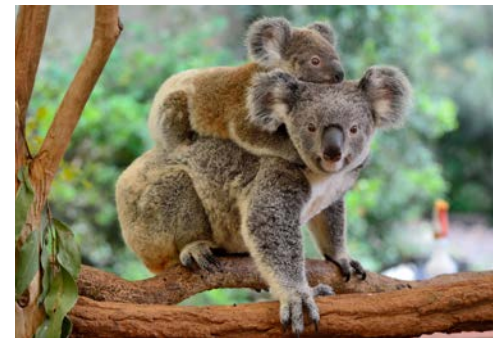
Einfach zum Knutschen – Koalas

Nach einer Citytour durch Canberra führt Sie Ihre heutige Fahrt u.a. zur Gold Creek Station. Hier werden Sie von Craig Starr und seinem Team willkommen geheißen. Die Gold Creek Station ist eine 400 Hektar große Farm, die seit über 30 Jahren Touristen Einblicke in das australische Landleben gewährt. Ihre Weiterfahrt führt Sie zur Batemans Bay mit dem gleichnamigen Ort, ein beliebtes Ferientziel für australische Städter. Mit Lakes Entrance erreichen Sie ein Paradies für Fischer, Freizeitkapitäne und Wassernarren aller Art – ein künstlicher Kanal, der eine herrliche Seenlandschaft mit der Meerenge Bass-Straße verbindet, hat hier eine wasserreiche Oase geschaffen.