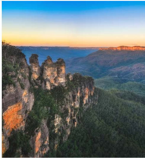
Die Blue Mountains

Entdecker, Natur-Liebhaber und Tier-Freunde aufgepasst – diese Reise entführt Sie ins Reich unter dem Äquator, in eine Welt, die von unglaublicher Flora und Fauna geprägt ist. Eine Welt, in der das Abenteuer noch erlebbar ist. Den Auftakt bildet Australien, das Land der Kängurus, dort, wo die Mittagssonne im Norden steht und der Mond „verkehrt herum“ zu- und abnimmt. Freuen Sie sich auf eine Rundreise mit Sydney, Canberra, Blue Mountains, Melbourne und vielen weiteren fantastischen Highlights! Die DIAMOND PRINCESS bringt Sie anschließend nach Neuseeland, das letzte Land, das je von Menschen besiedelt wurde. Das Gefühl, sich an einem jungen, unverfälschten Ort zu befinden, spürt man überall: ob die unberührten Landschaften, die noch ausgeprägte Flora und Fauna oder die unkomplizierte Lebensart der „Kiwis“, wie die Einwohner gerne mal genannt werden ... Hier erlebt man wahre Ursprünglichkeit.