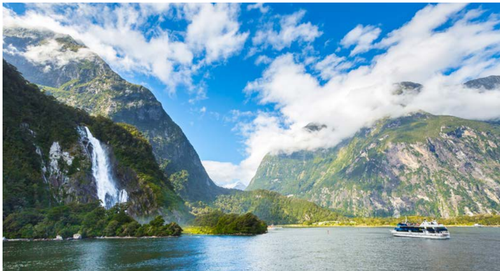
Im wunderschönen Fjordland-Nationalpark

drücke dieser spannenden Metropole. Und dann ist es so weit, der zweite Part Ihrer Reise erwartet Sie: Stolz liegt die DIAMOND PRINCESS zur Einschiffung bereit.