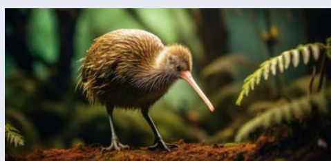
Nationalsymbol Neuseelands – der Kiwi