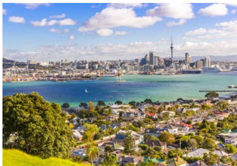
Blick auf Auckland

Vier Tage auf See - perfekt, um sich auf die kommenden Tage einzustimmen und Ihre „schwimmende Gefährtin“ kennenzulernen.