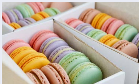
Französische Köstlichkeiten – Macarons ...

Am Vormittag erkunden Sie während eines geführten Stadtpaziergangs die malerische Altstadt von Avignon. Herausragend sind die romanische Kathedrale und die Ruine der Brücke Saint-Bénézet, die sich nur noch halb über die Rhône spannt. Das Herz der Stadt bildet der Place de l'Horloge. Anschließend nehmen Sie das gemeinsame Mittagessen in einem sehr guten Restaurant ein. Erleben Sie die Feinheiten der franzö-