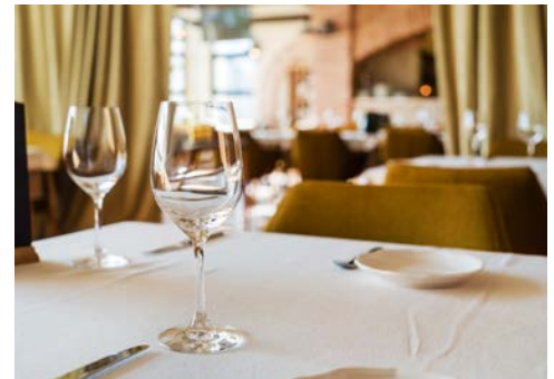
Im Sterne-Restaurant für Sie reserviert.

sischen Küche und verwöhnen Sie Ihren Gaumen mit ausgewählten Aromen. Darüber gestärkt unternehmen Sie am Nachmittag einen Ausflug in die bekannte Weinregion Châteauneuf-du-Pape. Einst Sommerresidenz der Päpste aus dem nahen Avignon, ist das Weinbaugebiet für seine hervorragenden Weine bekannt. Ein Besuch auf einem Weingut mit anschließender Degustation, ist ein besonderes Erlebnis.