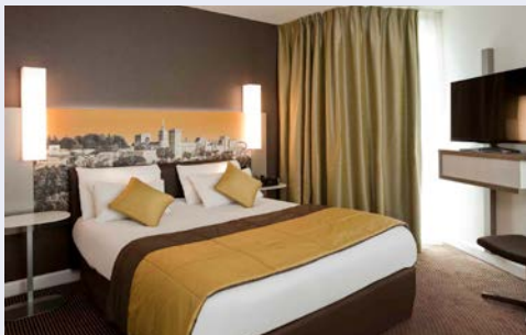
Beispiel – Hotelzimmer

Das Hotel Mercure Cité des Papes (Landeskategorie: 4 Ster- ne) liegt in unmittelbarer Nähe zum Place de l'Horloge, direkt am berühmten Papstpalast. Aufgrund der optimalen Lage sind zahlreiche Sehenswürdigkeiten schnell zu er- reichen. Cafés, Restaurants und viele kleine Geschäfte be- finden sich in der Nähe. Alle 73 Zimmer sind komfortabel mit Bad/WC, Fernseher, Telefon und Minibar ausgestattet. Die Zimmer der Kategorie Classic sind etwa 15qm groß und