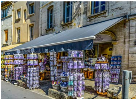
Avignon – Souvenirs aus der Provence