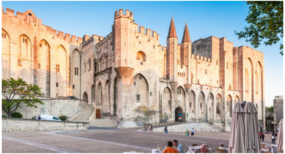
Papstpalast in Avignon

Entdecken Sie während dieser besonderen Reise die unterschiedlichen Genusspfade der französischen Küche. Mit den letzten warmen Sonnenstrahlen im Gepäck, oder im Zauber des Frühlings, erkunden Sie die alte Papststadt Avignon, besuchen die bekannte Weinregion Châteauneuf-du-Pape und erleben einen der bekanntesten Trüffelmärkte Frankreichs im Dorf Richerenches. Immer samstags wird der „schwarze Diamant“ gehandelt. Gelagert im Heck der Autos der Trüffelbauern, transportiert in Plastiktüten und Sporttaschen, ausgebreitet auf Klapptischen, zeigt sich ein zeitweise skurriles „Handelsbild“ in den schmalen Straßen und Gassen. Erleben Sie das ursprüngliche Frankreich, abseits der touristischen Hotspots. Schnell wird bei den Besichtigungstouren deutlich, wie sehr französische Leichtigkeit und mediterraner Esprit das Leben in der Region bestimmen. Gerade in Städten wie Avignon und Aix-en-Provence zeigt sich Südfrankreich von seiner charmantesten Seite.