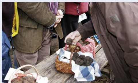
... und Trüffel