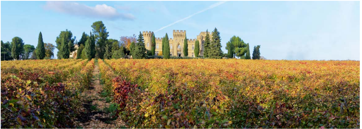
Weinregion um Châteauneuf-du-Pape