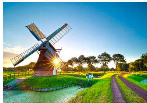
mehr Holland geht nicht ...

Ausschiffung nach dem Frühstück und Heimreise..