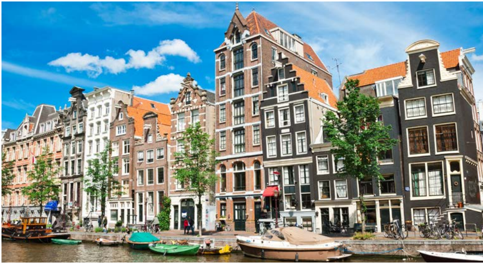
Willkommen in Amstrerdam