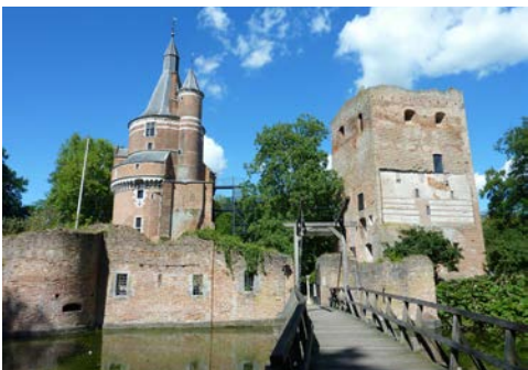
Wijk bij Duurstede

Am Morgen werden Sie bei einem weiteren herzhaften Frühstück mit dem Schiff in die Niederlande einreisen. Von Wageningen aus, folgen Sie einer Route durch das Naturschutzgebiet Veluwe und radeln durch Heideland und Waldgebiete. Die Niederlande sind bekannt dafür, flach zu sein, aber hier finden Sie einen leichten natürlichen Höhenunterschied in der Landschaft. Das Gebiet wurde in der