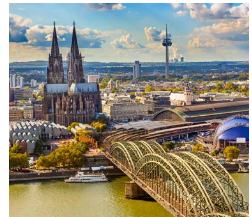
Köln am Rhein

Sie erreichen Köln am späten Nachmittag und haben noch etwas Zeit, sich umzusehen. Köln ist die älteste der größeren deutschen Städte, und wurde ebenfalls von den Römern gegründet. Sie erhielt ihre Stadtrechte bereits 50 Jahre nach Christus als Geschenk der römischen Kaiserin Agrippa. Später wurde Köln zu einem der wichtigsten Zentren des Heiligen Römischen Reiches. Wahrzeichen ist natürlich der Dom direkt neben dem Bahnhof und der Eisenbahnbrücke über den Rhein. Im Jahr 1248 wurde mit dem Bau des Doms begonnen und dieser wurde erst 1880 fertiggestellt. Das Abendessen erfolgt in eigener Regie in der Kölner Altstadt.