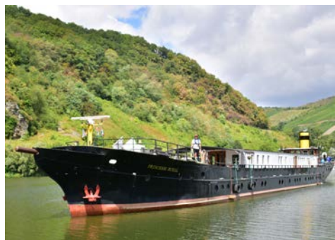
Die PRINCESSE ROYAL