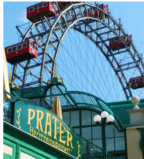
Wie wäre es mit einer Fahrt?