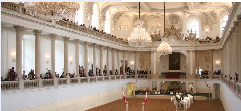
Morgentraining in der Spanischen Hofreitschule