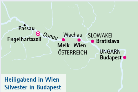
Heiligabend in Wien Silvester in Budapest

Einzelkabinen ab € 1.569,- (22.12.) bzw. ab € 2.529,- (27.12.) auf Anfrage, begrenztes Kontingent. Es gelten die A-ROSA Premium alles inklusive Bedingungen. Die Sonderpreise gelten für ein limitiertes Kontingent. 1 mit Zusatzbett. 2 Ersparnis beim Kabinenpreis im Vergleich zum Katalogpreis.