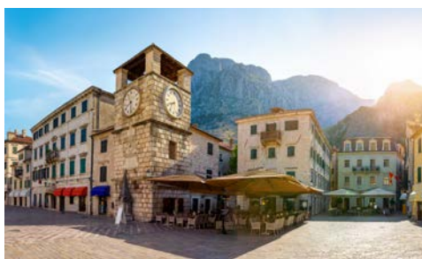
Uhrenturm in Kotor

Morgens Fahrt zum Kloster Ostrog, die letzte Ruhestätte des Heiligen Danilo. Wie ein Vogelnest in die Felsen gebaut, erwartet Sie einer der imposantesten Sakralbauten des Landes. Mit dem Minibus geht es hinauf und bei einer Führung entdecken Sie unzählige Schätze des Mittelalters. Danach Fahrt zum