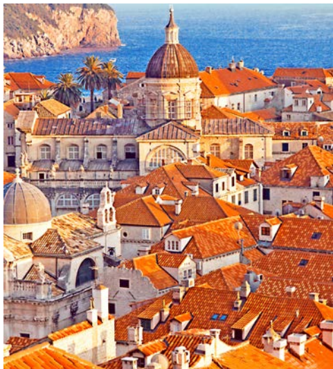
Auch Dubrovnik könnte auf Ihrem Programm stehen