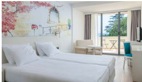
Zimmerbeispiel mit Meerblick