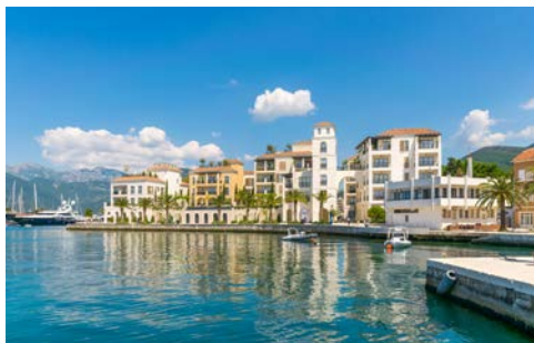
Der Hafen von Tivat

Nach der Ankunft in Tivat erfolgen die Begrüßung Ihrer Reiseleitung und die Fahrt zu Ihrem Hotel Ibero-star Bellevue in Budva (7 Nächte mit All inclusive; Landeskategorie: 4 Sterne). Ihr Hotel befindet sich im hübschen Urlaubsort Becici, etwa 2 km von Budva entfernt direkt am leicht abfallenden Strand. In der gepflegten und weitläufigen Gartenanlage befinden sich 2 Swimmingpools mit Sonnenterrasse und Poolbar. Buffetrestaurants, Bars und ein Souvenirshop runden das Angebot ab.