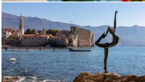
Perast (oben) und Budva (unten)