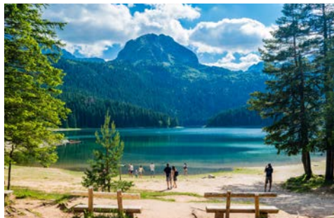
Der „Schwarze See“ im Nationalpark Durmitor

des Durmitor-Hauptmassivs. Um den See führt ein bequemer Spazierweg (1,5 Std. Gehzeit). Anschließend wandern Sie durch ein Tal mit alten Wassermühlen entlang des Baches Mliinski Potok zum idyllischen Bergsee Zminje Jezero und zu einem Aussichtspunkt auf die beeindruckende Felswand der Crvena Greda. Schwierigkeit: mittel/Höhenmeter: + 200 m/ca. 5 km (F, A)