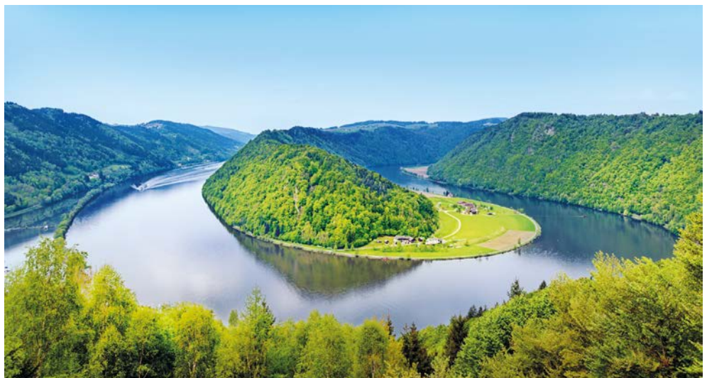
Wunderschön – Die Schögener Schlinge