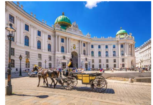
Kurze Verschnaufpause an der Hofburg in Wien

Sehenswert ist das Stift von Engelhartszell, bekannt für die schön renovierte Kirche, aber auch