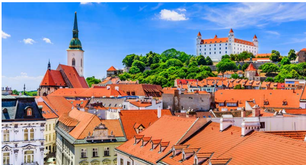
Die Pressburg in Bratislava

Vormittags erreichen Sie Bratislava. Entdecken Sie heute die kleine lebendige Hauptstadt der Slowakei. Tipp: Genießen Sie von der Pressburg einen herrlichen Rundblick und fahren Sie mit dem Oldtimerzug durch