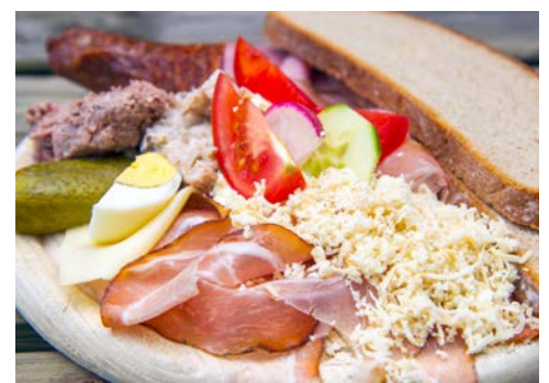
Nach einer Jause im Heurigen radelt es sich viel besser