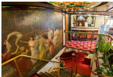
Einladende Lobby an Bord

für die „heilsamen“ Kräuterschnäpse. Hier beginnt die Radtour durch die romantische Flusslandschaft der Donauschlinge, einem der schönsten Donauabschnitte mit verträumten Dörfern am Fuße von saftig-grün bewaldeten Hängen. In Aschach gehen Sie wieder an Bord und setzen die Reise per Schiff fort.