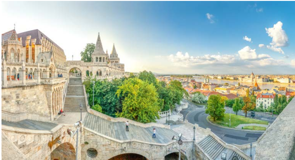
Die Fischerbastei von Budapest