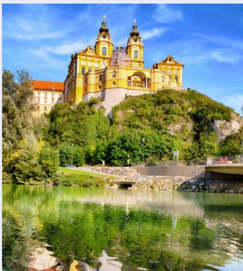
Das Stift Melk