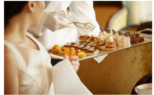
Genuss an Bord

Programmänderungen vorbehalten. An- und Abreisetage dienen ausschließlich der Erbringung der vertraglichen Beförderungsleistungen. Stand 07/24 – alle Angaben ohne Gewähr.