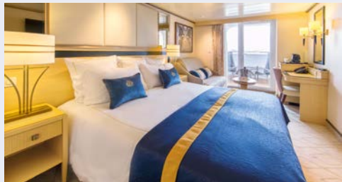
Balkonkabine – Beispiel

Mit der QUEEN MARY 2 erleben Sie Kreuzfahrt nach bester Seefahrertradition – Eleganz im Stil der klassischen Ocean Liner kombiniert mit Komfort, Moderne und Perfektion. Erleben Sie an Bord der QUEEN MARY 2 erholsame Urlaubstage mit vielfältigen, sportlichen und kulturellen Unterhaltungsmöglichkeiten sowie erstklassigen Service. Urlaub könnte nicht schöner sein! Freuen Sie sich u.a. auf einen spektakulären Ausblick auf den Sternenhimmel im einzigen Planetarium der Weltmeere, auf ein ausgewähltes Unterhaltungsprogramm wie Konzerte und Shows im Royal Court Theatre oder auf Entspannung im modern eingerichteten Mareel Spa® mit Sauna, Thalasso Pool u.v.m.