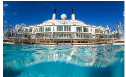
Entspanntes Leben an Bord

Weitere buchungsrelevante Informationen zu dieser Reise (An- und Abreise, Gesundheitshinweise, Barrierefreiheit, eventuell anfallende Mehrkosten während der Reise etc.) erhalten Sie im Internet unter: www.hanseatreisen.de