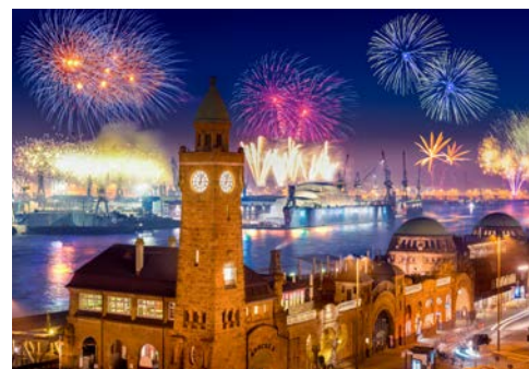
Tolles Erlebnis – Hafengeburtstag in Hamburg