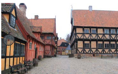
Den Gamle By in Århus

Vielleicht nehmen Sie heute im Wellness Studio an einer Yogastunde teil. Hier genießen Sie auch den weiten Blick über das Meer, während die Sonne über dem Horizont untergeht.