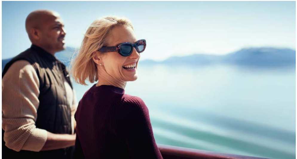
Gute Aussichten auf den Frühling

Liegezeiten: In der Regel erfolgt die Ankunft in einem Hafen morgens zwischen 6 und 10 Uhr. Das Ablegen erfolgt normalerweise am selben Tag zwischen 16 und 20 Uhr.