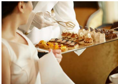
Afternoon Tea an Bord

Wie auch ihre Cunard-Schwester vor ihr, wird die QUEEN ANNE begeistert in Hamburg verabschiedet. Die Fahrt auf der Elbe in Richtung Meer ist etwas ganz besonderes, Schiffsfreunde stehen am Ufer und winken Ihnen zu ... was für ein fantastischer Auftakt für eine Kreuzfahrt!