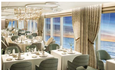
Einladend – das Queens Grill Restaurant

Das pulsierende Århus wurde vor über 1.300 Jahren von den Wikingern gegründet und wird oft liebevoll als „die kleinste Großstadt der Welt“ bezeichnet. Mit ihrem zu Fuß erreichbaren Stadtzentrum ist diese freundliche, einladende Stadt kompakt und birgt dennoch einige Schätze, die es zu entdecken gilt. Ein Spaziergang durch die stimmungsvollen Kopfsteinpflasterstraßen führt Sie an einer reizvollen Sammlung gut erhaltener Fachwerkhäuser vorbei, von denen viele in Kunstgeschäfte, Galerien und Cafés umgewandelt wurden. Im einzigartigen Freilichtmuseum Den Gamle By können Sie das Leben in Dänemark vor Hunderten von Jahren kennenlernen.