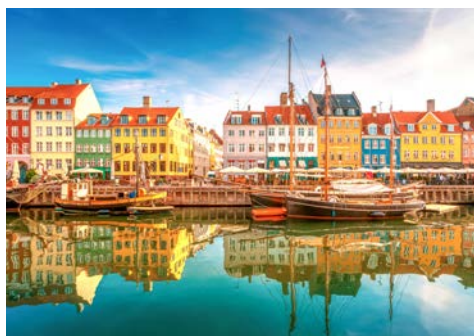
Nyhavn in Kopenhagen

Das im 12. Jahrhundert gegründete Kopenhagen ist