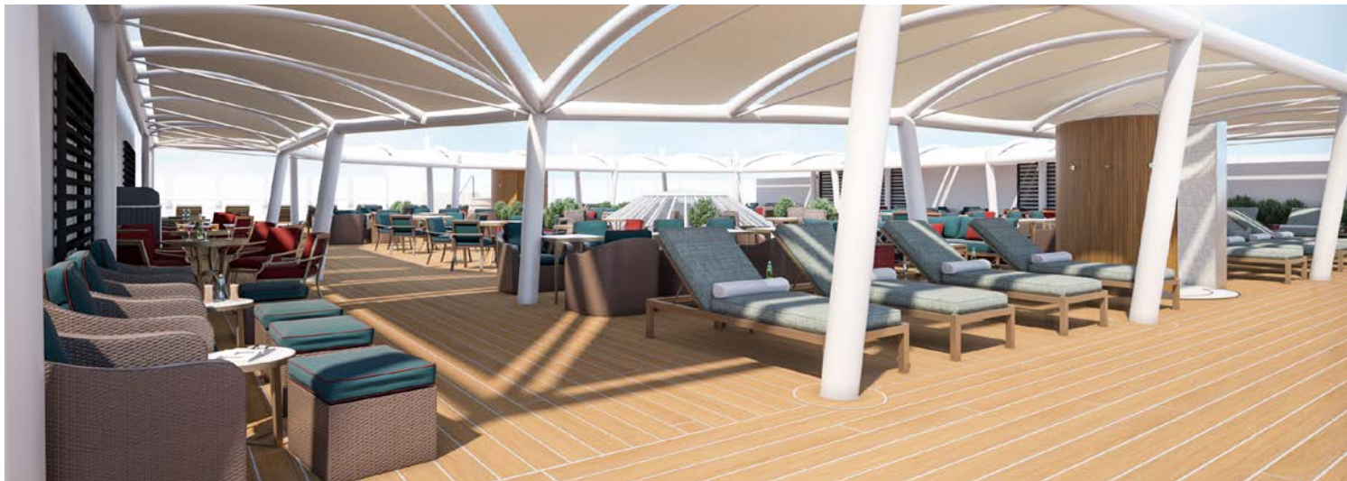
Hier lässt es sich gut gehen: Grill's Terrace

das alte Tallinn bietet in der Tat eine direkte Verbindung zur Vergangenheit, aber nachdem Estland erst 1991 seine Unabhängigkeit wiedererlangte, ist die jüngere Geschichte Estlands ebenso spannend. Jenseits der kopfsteingepflasterten Straßen und hoch aufragenden Gebäude der Altstadt finden Sie hippe Cafés, Galerien und kleine Boutiquen in den meist restaurierten ehemaligen Lagerhäusern. Wenn Sie sich an den Stadtrand begeben, haben Sie die Möglichkeit, farbenfrohe Barockpaläste und exquisite Sandstrände zu erkunden.